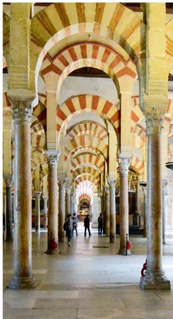
Mesquitaen (moskeen) i Cordoba færdiggjort i år 987 og så stor, at der senere i det 16. århundrede er bygget en hel kristen katedral inde midt i den.