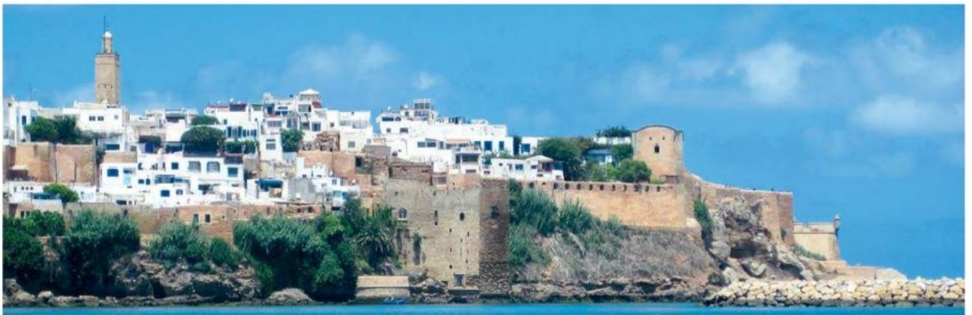
"Højt over indsejlingen Bou Regreg floden og Marokkos hovedstad Rabat knejser Medinaen (den gamle bymidte) og Kasbahen (den befæstede del). Til venstre i billedet ses Hassan minareten (nej i denne del af verden er en minaret ikke nødvendigvis slanke og rund)"

I Mohammedia stiftede vi så første gang bekendtskab med et arabisk land. En overvældende og intensiv oplevelse, som krævede lidt tilvending. Men med åbent sind og imødekommenhed var det en god introduktion til vores videre oplevelser. Casablanca derimod var lidt af en skuffelse – en stor og beskidt by med alle muligheder for at blive snydt. Ved siden af Hassan II moskeen, der er en af den muslimske verdens største,