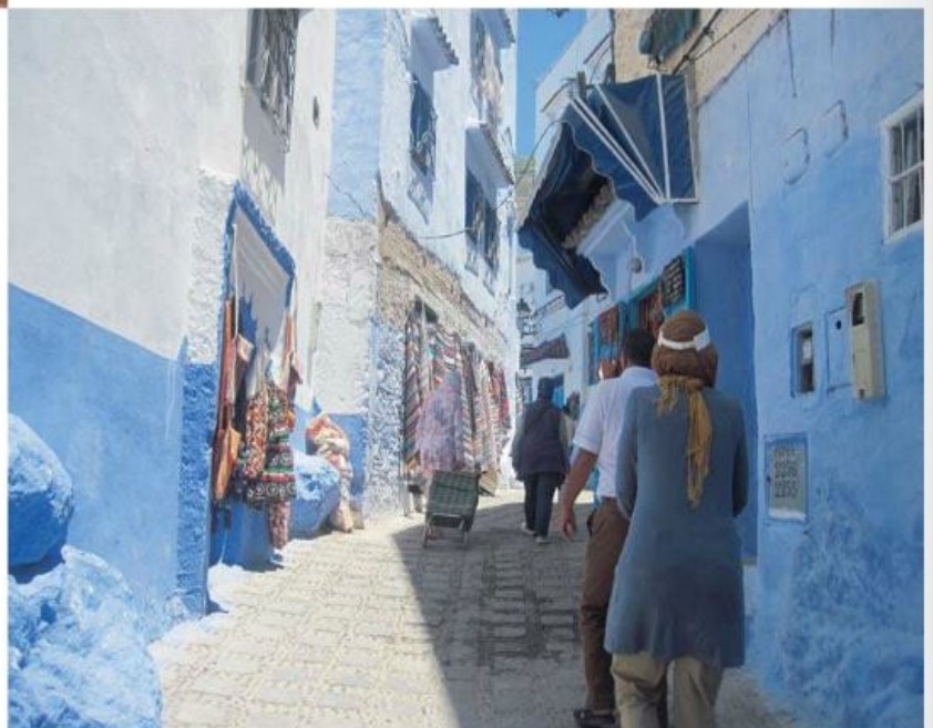
Marokko er et orgie i farver, her: Chefchauan.

De gode og velbeskyttede marinaer i Rabat og Smir gjorde det muligt at gøre nogle fantastiske ture ind i landet. Således besøgte vi Marrakesh, der er et orgie