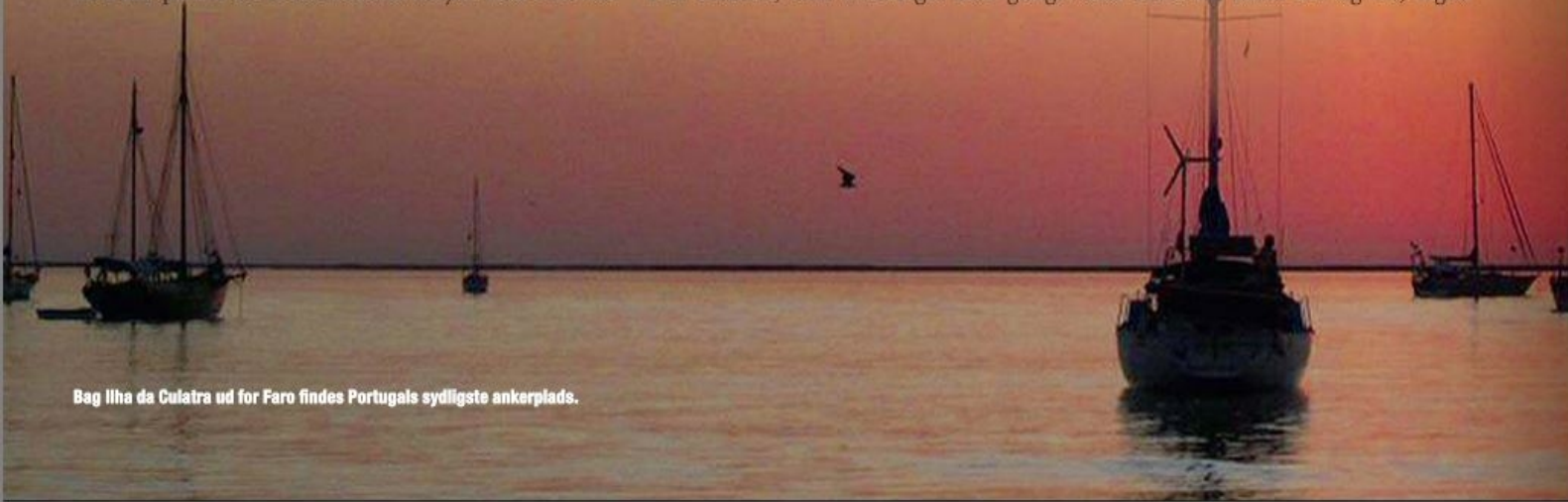
Bag Ilha da Culatra ud for Faro findes Portugals sydligste ankerplads.

Kyststrækningen videre mod øst går under betegnelsen Algarvekysten, og den er Portugals vigtigste feriemråde med mange små fine byer og gode strande. For sejlere er det imidlertid især de beskyttede laguner, som findes på kyststrækningen, der er interessante. Den portugisiske sydkyst er en såkaldt udligningskyst, der på mange måder kan sammenlignes med den jyske vestkyst. De øst-vest gående havstrømme glatter så at sige kysten ud, og efterlader store vandområder bag en række barriereøer. Indsejlingen til de beskyttede laguner finder sted mellem disse øer, hvor vandybden opretholdes på grund af det stadig frem- og tilbagestrømmende tidevand, når lagunen fyldes og tømmes ved høj- og lavvande. Vi var især begejstrede for lagunen ved Alvor, der er ganske lavvandet, og hvor Troldands sækkekøl var en stor fordel. Men også den meget større lagune ud for Faro, der er en nationalpark, var virkelig en oplevelse. Her lå vi for anker i mange dage i læ af barriereøen Isla Culatra, som vi besøgte flere gange. Helt uden for lands lov og ret, ingen