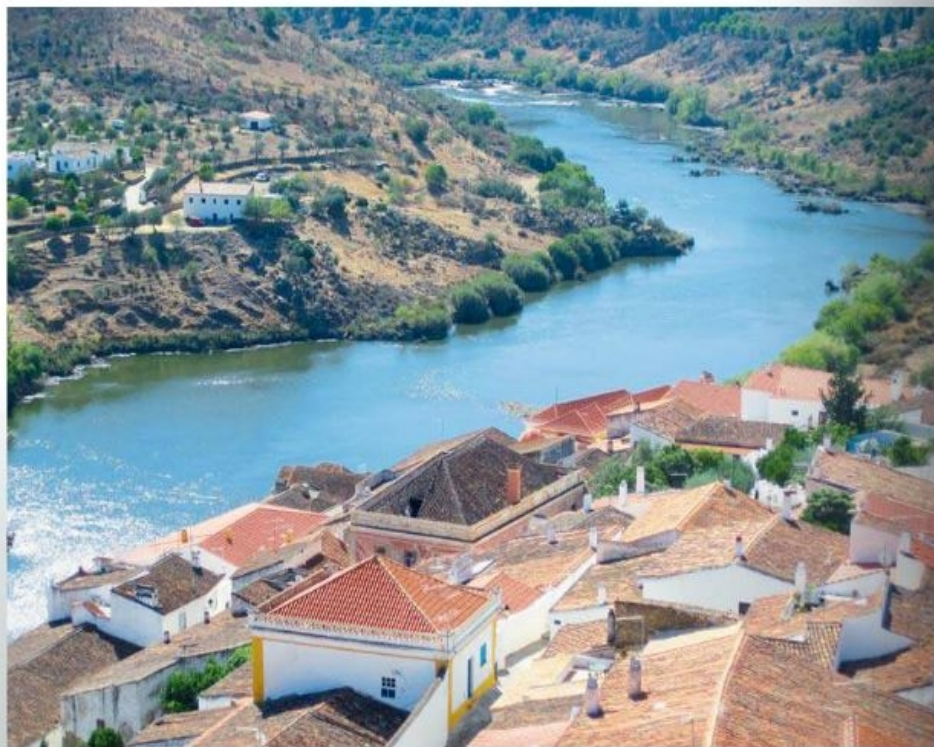
Udsigt over Rio Guardiana fra Alcutim.

Sejlere, der ikke er på vej mod Middelhavet – men har planer for et Atlanterhavskryds med ARC'en