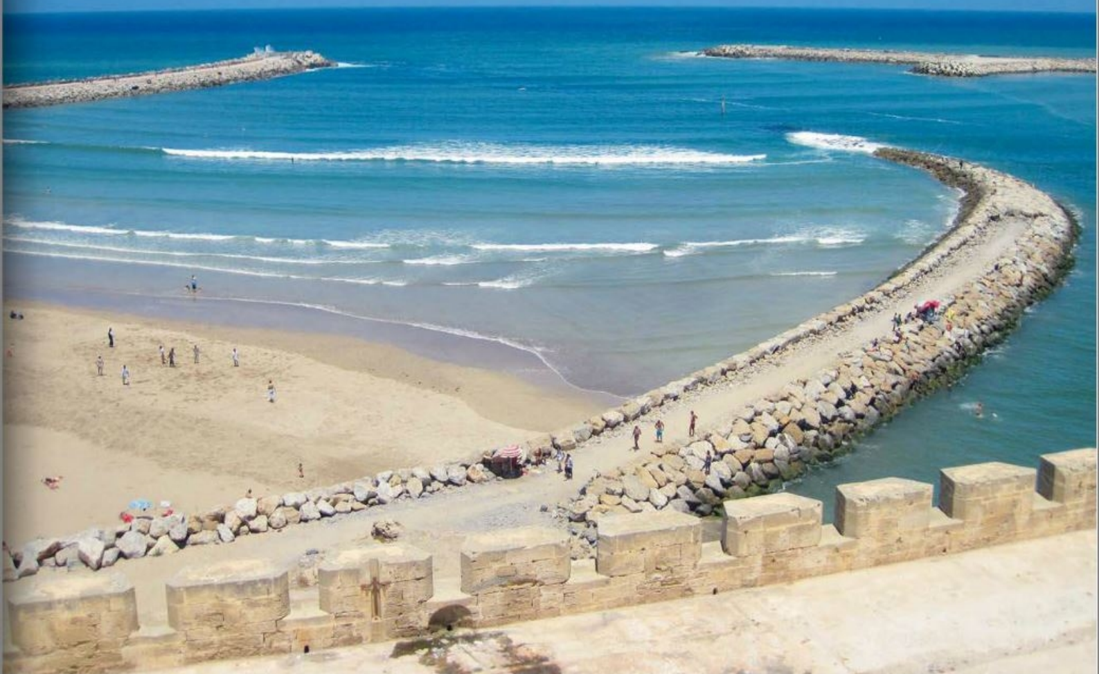
Indsejlingen til Rabat er en flodmunding, der tilsander. Lige nu meget fredelig, men i pålandsstorm et frygtindgydende sted.

kontor oppe i byen; men ingen problemer. En ung fyr fik pengene og smuttede på sin knallert op og kom fluks tilbage med det ønskede stempelmærke. Og alt i mens vi drak myntethe med paspolitiet.