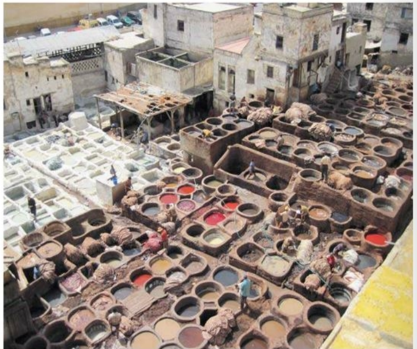
Farveri i den gamle kongeby Fez – lugten var frygtelig, og danske arbejdsmiljøregler et ukendt fænomen.

Knap 40 sømil nord for Mohammedia ligger Marokkos hovedstad Rabat. Rabat har et smukt gammelt bycenter (Medina) med en befæstning, der kontrollerede indsejlingen. Lige overfor på den anden side af floden ligger den gamle piratby Salé, hvor blant andre Robinson Crusoe, i henhold til fortællingen, sad kidnappet et stykke tid. Der er ikke en egentlig havn i Rabat, blot et par beskyttende moler omkring en flodmunding, der har tendens til tilsanding; men