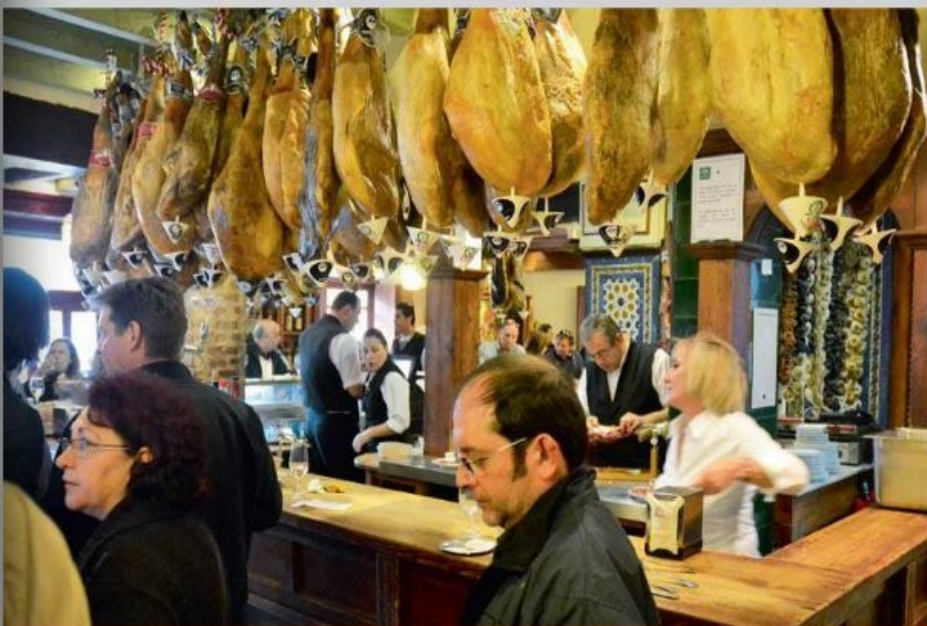
Sådan ender sortfodssvinene efter et langt og lykkeligt fritgående liv.

Med et seks måneders vinterophold er der rigelige muligheder for at lære byen og Andalusien bedre at kende. Med en lejet bil (det er billigt om vinteren) kan man nemt nå byerne Cordoba og Granada og få et godt