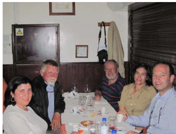
Venerne fra Erasmusprojektet i 1990