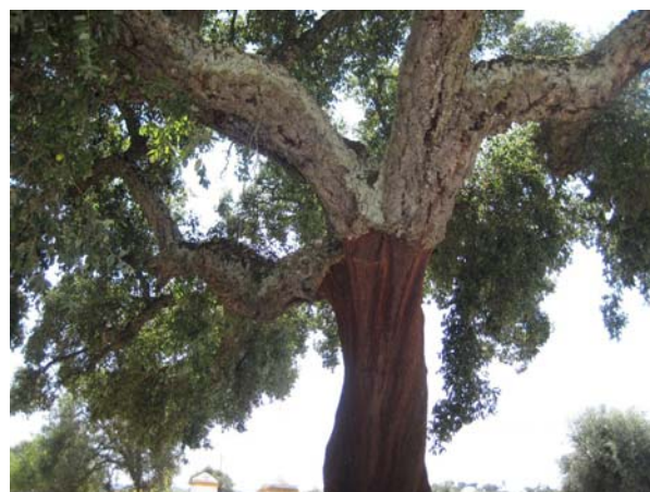
Korkeg der er blevet skrællet for nylig

følgelig bygget en del i området, og det var ret spændende at se på. Især de springvand og "vandkunster" der er i området, var sjove at se på. Selvfølgelig havde området også fået en ny banegård og busterminal, som var utrolig flot. I området er der også et Oceanium (angiveligt verdens næststørste). Det var meget flot og imponerende, hvordan de forskellige habitats blev præsenteret, alt fra pingviner og havodder til hajer, mantareys og en klumpfisk. Virkelig et besøg værd.