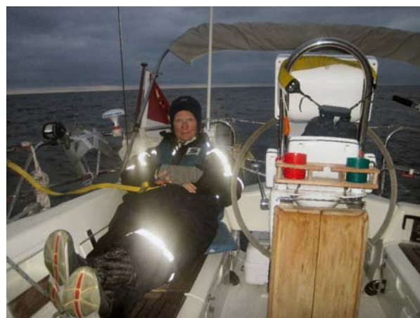
Rie på vagt klokken seks om morgenen

I syv og en halv dag havde vi tænkt meget på den øl vi skulle have, når vi kom i land. Vi havde været på ration på turen: en letøl pr. person pr. dag. Vi havde slet ikke drukket vores ration, kaffeforbruget var heller ikke så stort som beregnet, for vi havde drukket meget vand!