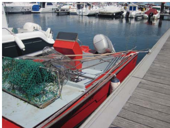
I modsætning til blåmuslingerne der opdrættes (dyrkes?) skræbes hjertemuslinger (berberechos) fra små både med primitivt grej

I Villagarcia er der hele ugentlige markeder og det er der en historisk baggrund for, nemlig en særlig tilladelse de fik engang tilbage i 1600- tallet. Der var marked i dag, og det var stort, rigtig stort. Det er bestemt det største marked, vi har været på her i Nordspanien. Vi købte lidt empenada og kage til vores frokost.