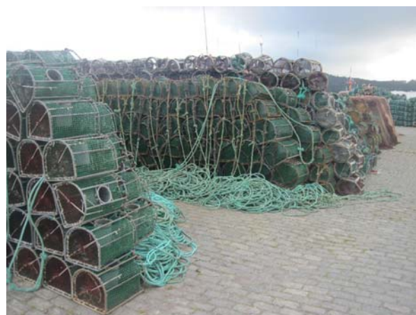
Havnen i Camariñas er præget af fiskeri og der ligger fiskefælder overalt. Det er denne her type der i lange rækker ligger dybt nede under de mange fiskebøjer.

Vi kom af sted fra La Coruña i søndags, der var vinden gået i nord-nordvest, men der var desværre ikke nok af den hele tiden, så vi måtte have maskinen til hjælp. Der var 50 mil til Camariñas som var vores destination.