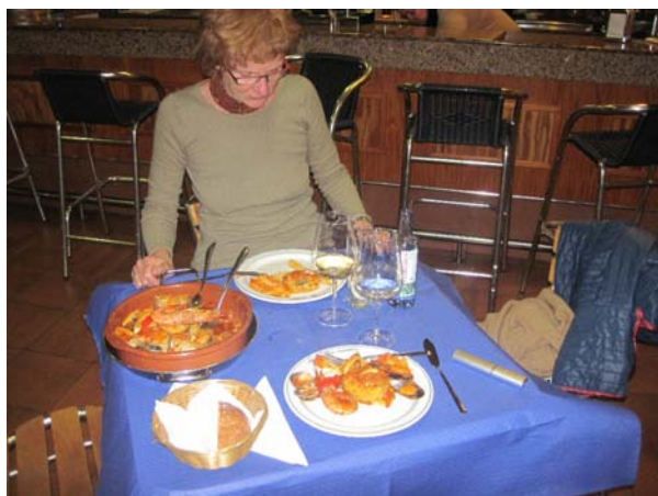
Zarzuela de Merluza,