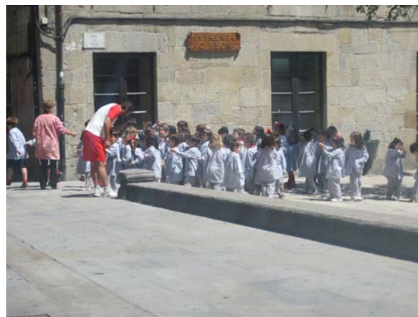
Frikvarteret er slut, tilbage til timen