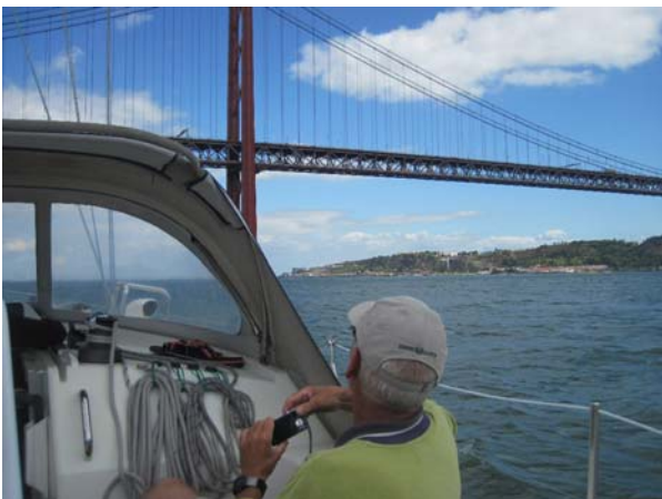
Lisboa! here we come

Efter øl og frokostpizza på havnen en velfortjent lang 'morfar'. Om aftenen ud og se på Cascais og et rigtigt godt og velfortjent måltid.... Men, hvorfor er det altid mig der skal lave mad i disse situationer?