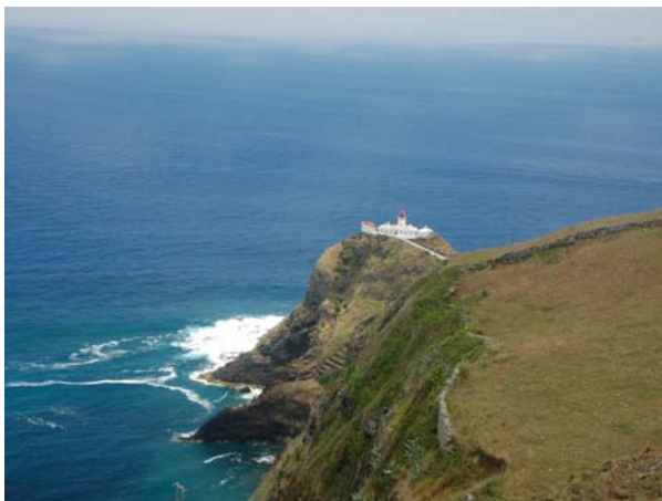
Fyret på den sydøstlige pynt af Santa Maria

Endnu en dag hvor vi lod os glide ind i Santa Marias stille og rolige levevis. Nogle gik op i byen om formiddagen for at se på markedet. Der er en lille markedsbygning med faste stader, hvor der sælges kød og fisk, men der var ingen grønsager i dag. Måske er det fordi der er byfest her over weekenden. Vi købte lidt til frokost, og spiste da vi kom tilbage til båden. Billedredaktøren var blevet færdig med billederne, og jeg gik i gang med at gøre den illustrerede dagbog færdig, så den kan komme på nettet. Vi har besluttet, at sejle videre i morgen, så den sidste aften her skulle jeg lave mad. Det blev til middag på Central Pub oppe i byen, hvor vi fik dejlig mad og øl.