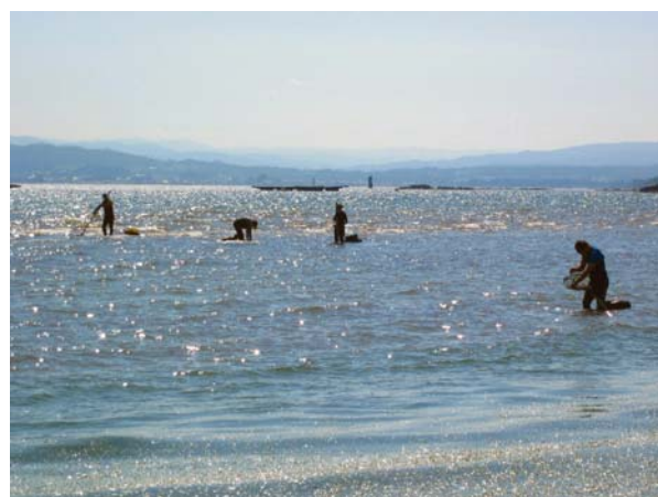
Der fiskes skaldyr i bugten ved Sanxenxo

området. Tilladelsen var omsider på plads (de havde sendt dem til Danmark, så det var meget heldigt at vi var hjemme og kunne tage dem med). Vejrudsigten var dog ikke helt venlig, idet den lovede, at det ville blæse op fra nord sidst på dagen. Isla Ons ligger helt ude på kanten til Atlanterhavet, og er en meget åben ankerplads, kun et sted man skal til under rolige vindforhold. Det blæste op hurtigere end vi havde håbet på, så selv om vi havde indhentet de fornødne tilladelser til at tage derind, så droppede vi det. Det viste sig at være en fornuftig disposition, for i den vindretning havde det ikke været sjovt at ligge derude. Vi endte i Pobra de Caraminal som vi har besøgt tidligere.