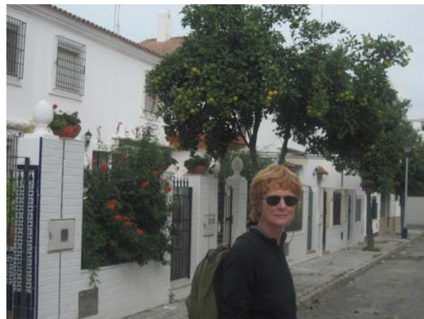
Chipiona: Jeg synes det er pænt når man bruger appelsintræer som vejtræer

simpelt hen ikke” og ”det virker altså ikke” fik han det som sædvanligt alligevel til at virke, men ikke uden brug af al hans stædighed og tålmodighed. Både i går og i dag spiste vi håndmader; det kæmpemåltid i Villa Real, ligger stadig som en god bund.