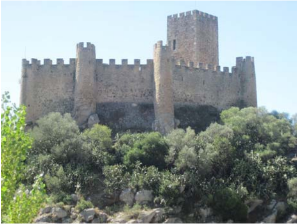
Borg lidt uden for lands lov og ret, midt i en flod, her var ingen turister