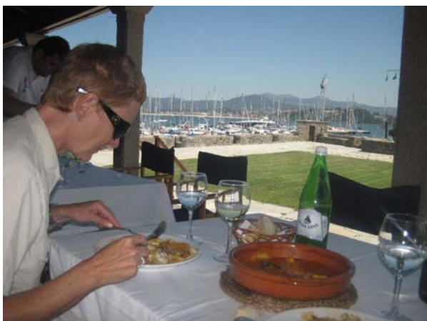
Carcuella de pescado i sejlklubben i Bayona

Vi var tidligt oppe og ude af havnen i Cambara klokken ni. Der var 23 nm til Bayona og vi var der ved et-tiden. Der var en masse både der flagrede over top. Det var Rally Portugal 2011, der lige var landet med 16 både. De kom lige fra Sydengland, og dette er deres første stop inden de fortsætter på tirsdag til et sted i Portugal. Jeg må indrømme, at jeg følte mig lidt overvældet over så mange mennesker og alle de rigtig store både, der er her. Men det er nok fordi vi har været udenfor alfarvej så længe og at ferisesæsonen er ved at komme i gang. Vi tog en stratisk beslutning og gik op for at spise i klubhuset. Vi fik alletiders carcuela de pescado. Vi måtte godt nok vente næsten en time på den, men det var ventetiden værd.