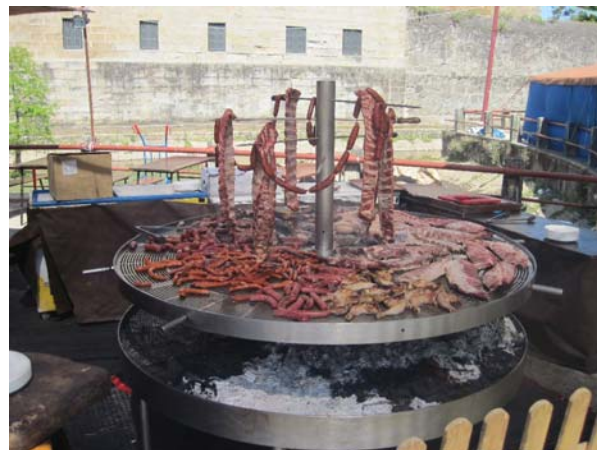
og der var kød i rå mængder!

Det projekt håber vi på er færdigt i løbet af weekenden. En tredje ting vi havde med, var stof (det vil side gammel brugt sejl) til vi kan sy betræk til vores gummibåd, også et projekt vi gerne vil have overstået i en overskuelig fremtid.