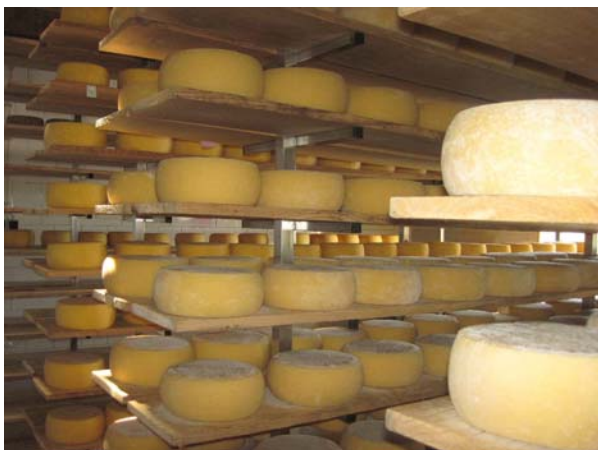
Lokal produktion af ost på mejeriet Canada