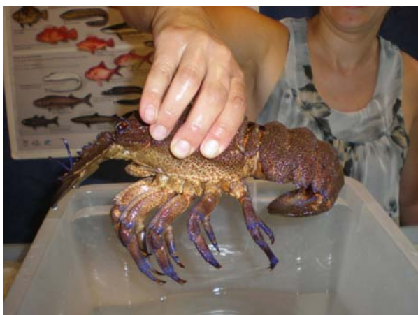
Vores forret: Slipper-lobster her fra øerne

som en blanding mellem hummer og spider crab.