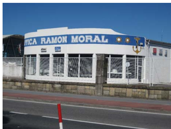
Værkstedet hvor Sten kom til at kende medarbejderne rigtig godt

I morges begyndte vi på at sy betræk til gummibåden, et betræk der kan sættes på når der hænger i daviderne, for at beskytte den mod solen. Vi havde lavet et mønster i gennemsigtigt plastik inden vi tog hjem, og havde medbragt et gammelt sejl skåret i passende stykker, da vi kom herved. Så kom mors gamle Singer fra 1974 på arbejde. Vi fik en del motion, ved at løbe op og prøve og ned og sy, løbe op og prøve og ned og sy, løbe op og prøve og ned og sy og den mindste del af tiden er ved symaskinen, men ved at prøve. En ting lærte vi: en ting er at have et godt mønster i blød plastik, en anden ting er, at få det til at passe når det skal sys i sejldug, som er lige så smidigt som karton, men vi kom da et godt stykke i dag. Vi måtte holde op, da det blæste op og vores prøvesessioner endte med at vi måtte ligge fladt over gummibåden, for at holde på presenningen, og så var det ekstra svært at passe til.