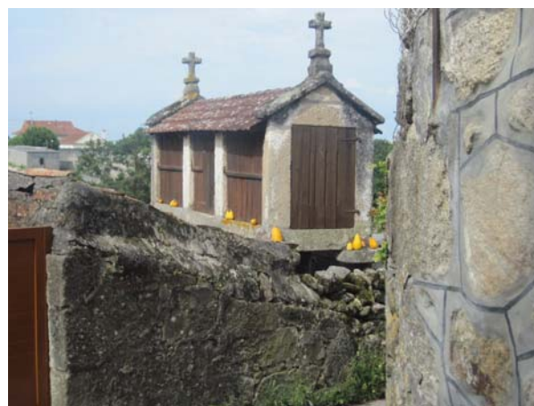
Fjorrdskammer i Combaró

et mål for mange turister. Det er stadigvæk udenfor sæsonen, så her er bestemt også plads til os. Vi skulle have vores eftermiddags snack og Sten måtte have blæksprutter i dag. Vi faldt ind et sted, med en servering i haven og udsigt over fjorden. Sten fik sine blæksprutter og jeg en salat og et glas Abariño til. Vi spurgte til den vinplante der dækkede hele haven med sine blade og frugter, og fik at vide at hendes far havde plantet den for 80 år siden. Hendes familie havde boet i huset i hvert fald i tre generationer, og der havde altid været bodega her. Hun viste os den oprindelige barstue, hvor der var plads til to (små) borde. Hun fortalte også at tidligere kom en stor del af byens indtægter fra pirateri. Byen er også godt beskyttet mod vandet, da der ikke umiddelbart er havnemuligheder. Den marina vi ligger i er kun fire år gammel. Hun var i øvrigt meget kommunikativ, og selv om vores spanske er blevet bedre, så er det ikke altid jeg kan følge med, når de skruer turbo på, og det gjorde hun. Statsministeren er ikke særlig populær i disse egne og hun gav udtryk for, at det nok ikke kun er politiske problemer Spanien står over for, men at der også er nogle kulturelle udfordringer. I øvrigt går Sten jo og drømmer om at få en Zarzuella en dag, hun sagde at det skulle hun nok lave til ham, bare hun blev advaret dagen før.