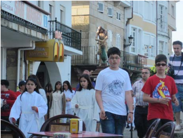
Páskeoptog i Muros, det eneste vi nåede at opleve i den påske der druknede i regn