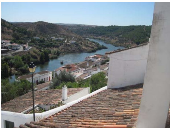
Udsigt iver Mertolas tage

spiste frokost, til Serpa og kaffen indtog vi Loulé lige ved siden af det meget imponerende marked med rødt tag.