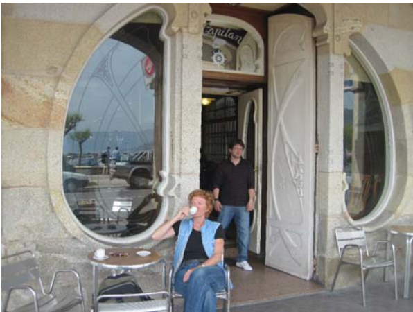
På denne café i Muros måtte vi ha' os en kop kaffe - og et billede!