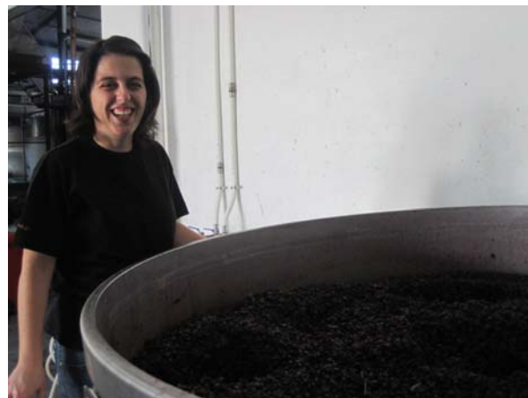
Vinmageren viser stolt sin prøveproduktion frem i det hun kaldte sin legestue, et forsøgslaboratorium