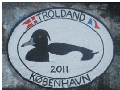
Troldands logo der ifgl traditionen skal efterlades i Horta

taget med bussen til Angra, mens vi venter på mekanikeren, og som vejrudsigterne ser ud lige nu (ingen eller meget lidt vind), kan der godt gå endnu et par dage, inden vi kommer af sted.