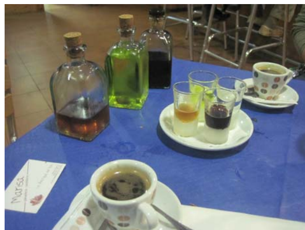
Smagsprøver på de lokale aquadient'er

Jeg bliver nok nødt til at lave mad der igen. Da vi kom til kaffen, mente værten, at vi skulle smage alle de fire aquadientes (snapse), der er karakteristiske for området! De er nok lige for søde for vores smag, temmelig likøragtige- spændende at prøve. Vi sov godt den nat!