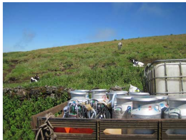
Glade køer, der er på græs året rundt og bliver malket ude på markerne