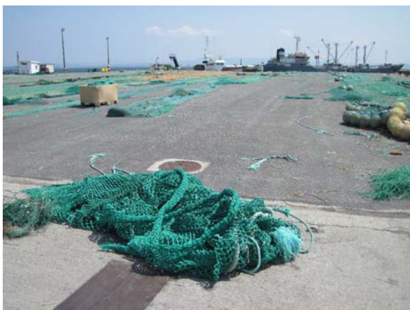
De farlige fiskegarn

Torsdag gik vi en tur her i Santa Eugenia de Rivera. Her er en kæmpe fiskerihavn, med i hvert tilfælde 15 trawlere og en masse andre fiskefartøjer. Der er en plads på størrelse med en fodboldbane, hvor de gør deres net klar. Vi blev rigtig bange, da vi så de net: de er knyttet af virkelig kraftig stramt flettet nylonnor, som er blevet godt strakt med tiden, så det næsten er som stålwire. Jeg får ondt i maven ved at tænke på at få sådan et i skruen.