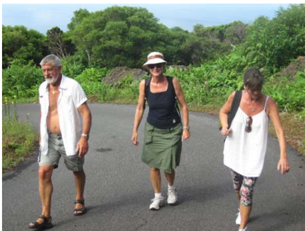
Ude og se på natur på Faial