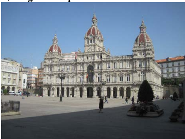
Plaza Mayor i La Coruña