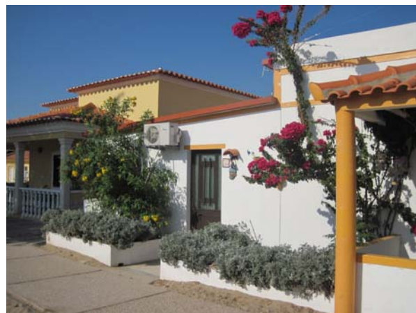
Culatra: byen i klitterne

Da vi stødte på en samling huse, der lå halvvejs mod Farol, stoppede vi op og så på omgivelserne. Det var et meget dødt sted. Alle husene var tillukkede og der var ingen på gaden... eller mellem husene. Der er ikke