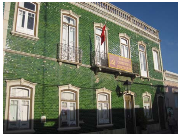
Smukt hus med grønne glaserede kakler og et rødt flag: Kommunisternes hus i Vila real Santo Antonio