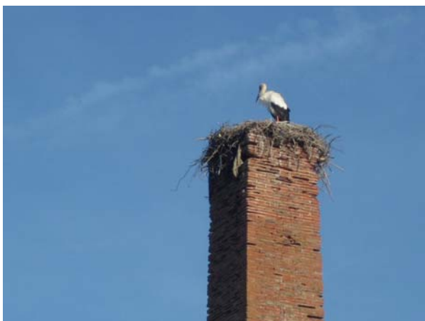
En stork har bygget rede på skorstenen på en nedlagt fabrik i Villa real santo Antonio