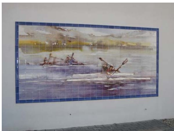
Azuleros på en roklub i Vila Real, teknikker er helt traditionel, men motivet og billedet er meget moderne.