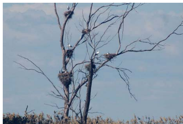
Der sad masser af storke i træerne på vej op ad Guadalquivir

blevet orienteret. Det viste sig, at det skib, vi troede vi skulle følges med, skulle igennem klokken tre i nat! Meeen, han skulle have et skib ud klokken otte, og så kunne vi blive sluset ind lige efter det. Vi slog til med det samme, for så var vi da på vej. Alt dette foregik på spansk, og Sten holdt tungen lige i munden og egentlig var vi lidt spændt på om vi overhovedet havde forstået det rigtigt. Umiddelbart efter lykkedes det os at komme i kontakt med Klaus, som også havde opdaget, at vi det skib vi oprindeligt troede vi skulle følges med, først skulle igennem midt om natten. Vi fortalte ham om den nye plan og han lovede at følge op på den og vende tilbage til os, hvis vi havde misforstået noget. Han vendte ikke tilbage, og vi betalte vores regning i Gelves og gik os en tur på velkomstmolen inden vi gjorde klar til at sejle. Der lå en båd der hed Susannah; jeg tænkte på om det var den marineroen havde nævnt, om de også var på vej til Club Nautico. Det viste sig, at det havde de været, men havde opgivet det, for de var ikke sikre på om den reservation havnekontoret i Chipiona skulle have ordnet var ok, for de havde ikke fået nogen bekræftelse. Dertil kom, at det der med sluser og broer ikke rigtig var til at finde ud af. Liz og Roger besluttede sig dog hurtigt for at tage chancen og sejle i vores kølvand.