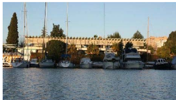
Endelig på plads i Club Mautico Sevilla

Afgang Marina Sunsails klokken syv, igennem broen klokken otte, på plads i Club Nautico Sevilla klokken kvart over otte efter halvanden mils sejlads.