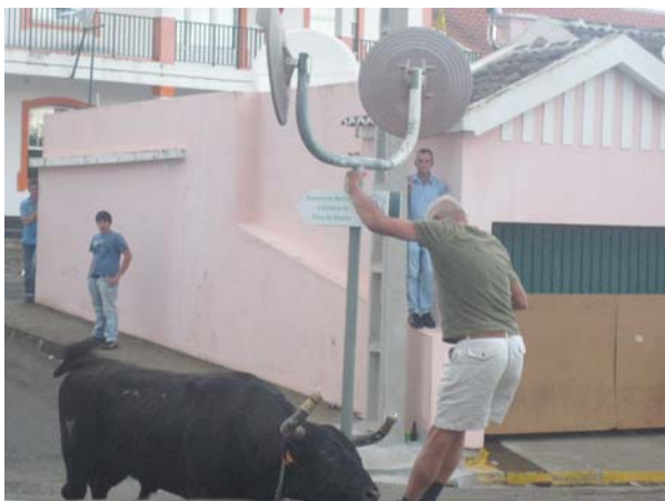
Turen tog fejl af svenskerens ben og stangen til skiltet

Radaren startede i øvrigt helt fin da reparatøren kom. Men da den blev slukket og skulle starte igen, så ville den ikke. Fejlfindingsprogrammerne blev kørt og teorien er nu, at der er noget galt med strømforsyningen til antennen, og Radarmanden ville forhøre sig hos Raymarine. Det haster ikke, da vi jo nok kommer tilbage hertil i løbet af sommeren, så det bliver spændende at høre fra ham senere. Om eftermiddagen iførte vi os badetøj og gik over til stranden (100 m) for at bade. Sandet er sort lavasand og meget varmt nor solen har skinnet.