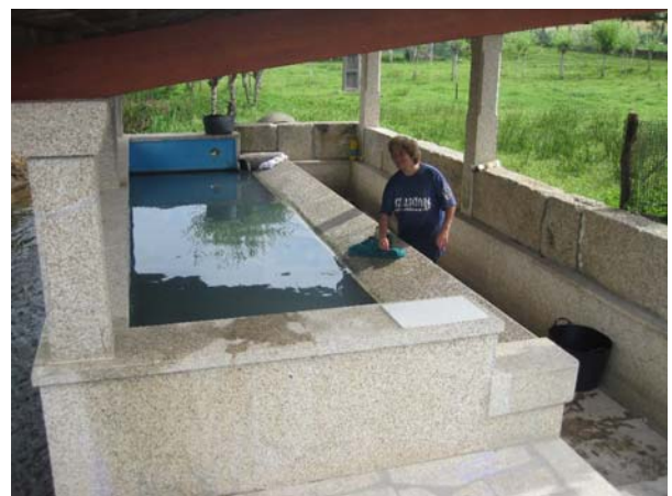
Vaskepladsen i landsbyen bliver faktisk brugt