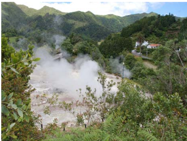
Jorden ryger og søerne og vandpytterne koger på Sao Miguel

fish). Meget lækkert. Vi fik alt, hvad der hører en afskedsmiddag til, med kaffe og en gylden aguardiente, mere conac-agtig end det vi har fået af de lokale.