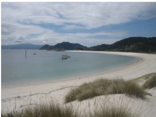
Islas Sies er berømt for sin lange dejlige strand

Så er vi på Islas Cies; de gange vi har været forbi nogle af de atlantiske øer (sidst Islas Ons) har vejret ikke været til det, men det er det nu, og det er ikke weekend. I weekenden skulle der være overrendt, og det kan man godt forstå, når man kommer herud. Øerne er en del af et naturreservat, og man skal have en generel tilladelse til at sejle her, samt en særlig ankertilladelse ved hvert besøg. Den har vi fået, så alt er under kontrol. Vi ligger nu for anker bag disse øer der ligger med ryggen ud mod Atlanterhavet, i en bugt med en strand der bare er så lang.