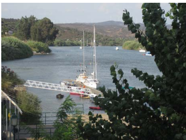
Rio Guadiana er et meget fredeligt hjørne af verden. Troidand ved broen i Alcutim