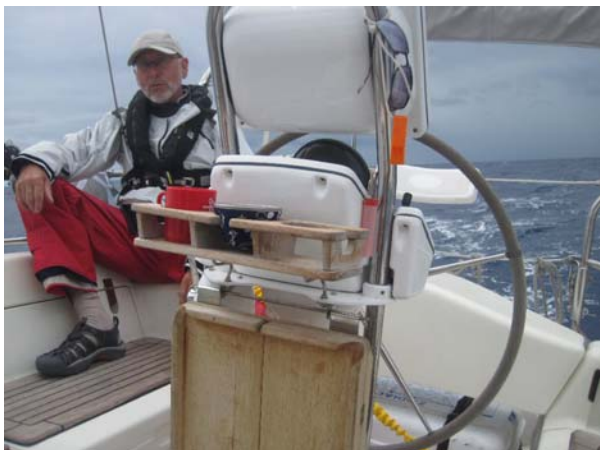
Selv om det var hæsblæsende var det rimeligt afslappet