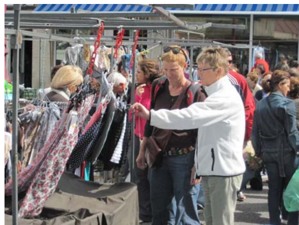
Villagarcía er en meget aktiv markedsby

nationalpark, som man skal have tilladelse til at komme til, ligesom de fleste af øerne her i