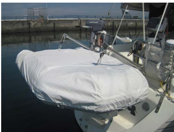
Resultatet af vores anstrengelser: et dækken til gummibåden

Det er i dag at man holder fri for at fejre Santa Rita. Oven på gårsdagens aktiviteter var vi spændte på, hvordan det så ud i dag: der var dødt, der skete ikke spor, ikke en sjæl på gaden, de få vi så, var enten nogle der hang over en kop kaffe for at forsøge, at blive mennesker igen, eller nogle ældre mennesker der ikke havde festet til klokken fem i morges. Vi hørte musik og sang hele matten og knaldfyrværkeri med jævne mellemrum. Jeg forsøgte at finde ud af, hvem der skød og hvorfor, men blev ikke klogere end: at man