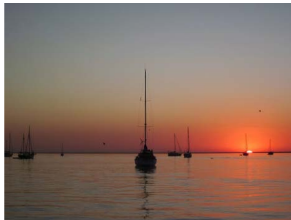
Solnedgang ved Illa Culatra