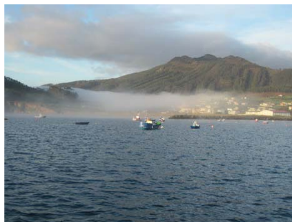
Morgentåge over Ortiguera set fra Camariñas

der lignede en svømmehal. Det var en svømmehal! Så det udnyttede vi og fik os en god svømmetur i går. Det var lige noget vores kroppe havde brug for. Desværre er der lukket i dag søndag. Vi sejler videre i eftermiddag, men kun ud til indsejlingen af floden. Det er højvande her om eftermiddagen, og skal vi videre til Cideiro har vi ikke lyst til at sejle så sent. Derfor skal vi bare ud over tærsklen, så det bliver en to timers tur ud til Cariño, hvor planen så er at sejle videre derfra i morgen. Det så ud som en rigtig god plan i morges, da det var flot klart vejr. Men nu regner det, så måske skal vi have olietøj på... øv, men nu må vi se, der er et par timer endnu.