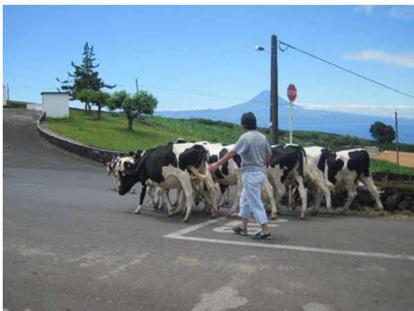
To flokke kører og os vi bil skulle passere hinanden i et vejkrøds

Så vi lejede en bil, pakkede den med badetøj, vandresko og meget mere og kørte så vestpå. Vejret blev bedre op ad dagen, men vi tog os god tid til at se på de små steder, så vi nåede hverken at bade eller at gå; det må vi gøre en anden dag. Vi kørte ud langs sydkysten og tilbage langs nordkysten, som er meget forskellige. På nordsiden så vi igen de levende hegn med hortensia, vi havde set, da vi var ude at gå i sidste uge. Det er utroligt så smukt det er. Sydkysten er grøn; som Leila siger, at er der en lille revne mellem klipperne så vokser der noget. På både på nord- og sydkysten finder man så de såkaldte Faiãs, dvs. lave kystpartier, opstået når store dele af den stejle kyst er skredet ud i havet, meget frugtbare og intensivt udnyttet. De fleste af disse kan kun nås til fods eller med 4WD, men det lykkedes os at besøge Fajã dos Cupres med vores lejede Yaris. Det var en temmelig stejl ned og opkørsel som Leila bestemt ikke nød, men et spændende sted at besøge. Igen i aften måtte jeg bide i det sure æble og lave mad. Det blev på en restaurant oppe ved den lille park midt i byen.