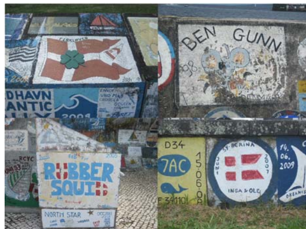
Andre både hjemme fra klubben har afleveret deres visitkort her i Horta havn