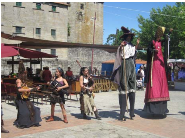
Middelaldermarked i Villagarcia

mærke til, at der også var boder oppe i en af parkerne allerede i går. Og i dag var der også boder på broen over til det gamle kastel og kirken. Her blev der solgt lokale produkter fra Castillia y Leon, og de var ikke karrige med smagsprøver.