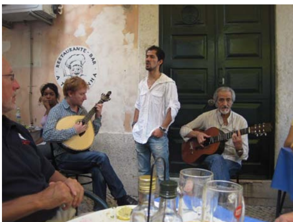
Både mænd og kvinder synger fado, det er fantastisk stemningsfuldt

Bytur: Frokost i Alfamaen, hvor vi var så heldige at falde ind et sted, hvor de var fado; to musikere på guitar og fire der skiftedes til at synge, og de kunne synge! Der var en meget fin stemning, vi var helt kedede af det, da vi var færdige med at spise og skulle gå. Derefter tog vi på en sightseeing tur med bus. Vi stod af bussen i Belém (udtales Blem) og så lidt på den bydel inden vi tog en bus hjem til MarinaExpo.