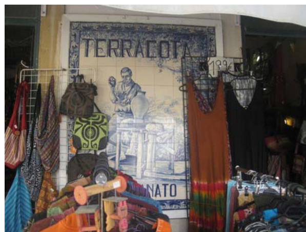
Azuelos er en dominerende del af udsmykningen i denne del af verden, her i en kludeforretning