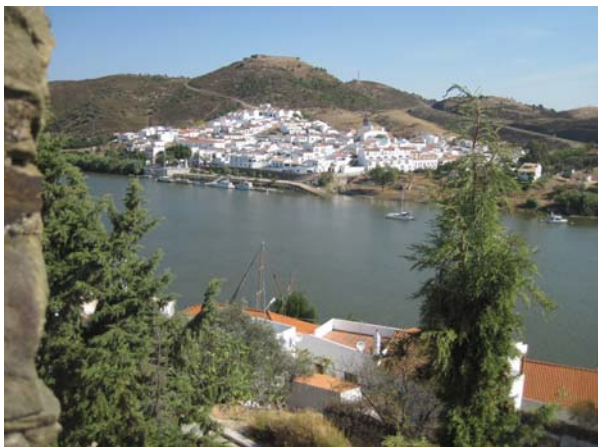
Udsigten fra borgen i Alcutim til Sanlúcar i Spanien

Drak morgenkaffe og fik et stykke ristet brød med de lokale på havnens café. Den plads vi i første omgang havde fået anvist var i og for sig ok, men med en kuling undervejs som vil blæse agten ind i cockpittet, var ikke lige sagen. No problem! vi fik en anden plads og flyttede båden, så vi kom længere ind i havnen og fik stævnen i vinden. Så gik vi en tur op i byen. Det er en dejlig by, meget hvid, fredelig og vejtræerne er appelsintrær! Det kan jeg godt lide. Der var en slagter, supermarked, grønhandlere, så vi fik provianteret lidt. Det begyndte at blæse op i løbet af eftermiddagen, og det tog langsomt til i løbet af aftenen.