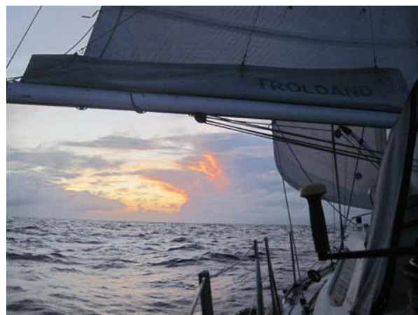
Solopgang til søs er altid facinerende