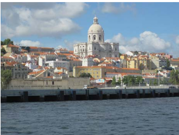
Det var helt vemodigt at sejle fra Lissabon, en meget spændende by, vi blev slet ikke færdige