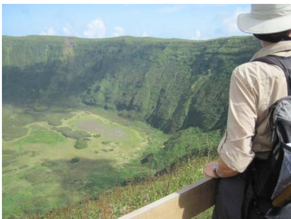
Fantastisk udsigt over det store krater på Faial