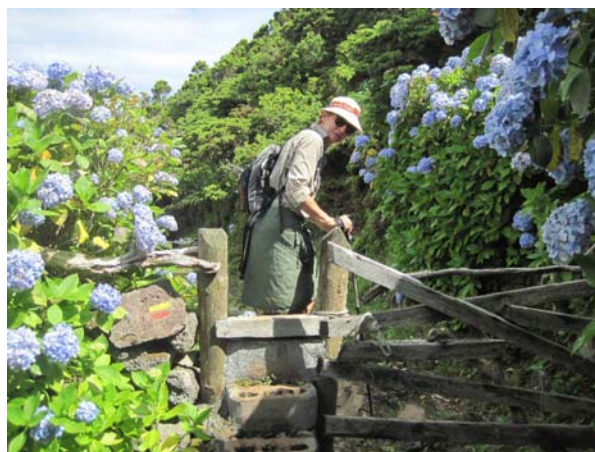
Man går i skove af hortensia på Sao Jorge

Kuhls skråbe (Coreys sheerwater), den fugl der havde fulgt os hele vejen over fra Galicien til Santa Maria, yngler i kolonier både på Portugals kyst og her på Acorerne. Et af stederne er på klipperne her bag havnen. Om dagen er de på havet og fouragere og om natten kommer de hjem, og når det bliver mørkt bliver klipperne og havnen levende af deres sang og kald.