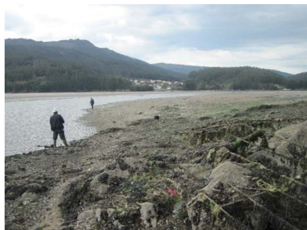
Lystfiskere ved Ortiguera

Så kom vi fra Viveiro! Det var godt nok tåget, da vi vågnede, men den lettede op ad formiddagen, og vi skulle først af sted ved 11-tiden for at være fremme ved Ria Santa Martha de Ortiguera: to timer før højvande. Det var godt nok lidt vemodigt at tage fra Viveiro, som vi har lært rigtig godt at kende. Nu havde vi været helt klar i et par dage og kun ventet på at vejret blev bedre, så det var også en dejlig fornemmelse at sejle ud, da tågen var lettet og nyde udsejlingen af den smukke ria (fjord) som Viveiro ligger i. Solen skinnede fra en skyfri himmel, men det blev koldt da vi kom ud af fjorden. Vind var der ikke meget af, så det gik for maskine. Vi var fremme ved indsejlingen til Ortiguera tre timer før højvande, men vi sejlede ind alligevel. Det var godt nok med udkig i stævnen og langsom fart, så langsomt det kunne blive med tre knob tidevand med os. Det gik fint, og vi havde på intet tidspunkt mindre end to meter vand under os og det var ellers et sted der advares meget om i pilot bogen.