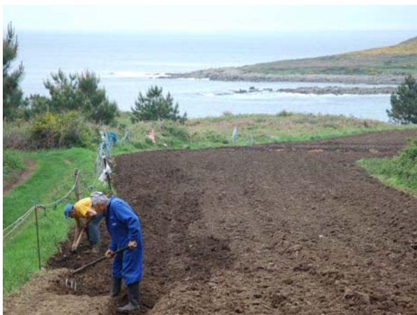
Landbrug i udkantsspanien

Torsdag den 14. april sejlede vi fra Camarinas til Portosin i fin vind fra nord øst. Det blæste 8 til 11 m/s så det gik dejlig stærkt. Vi skulle godt nok spidse op da vi kom ind i fjorden, men det gik lige og vi startede først motoren lige uden for havnen, fedt. Der var tre gæstende både ud over os: finner, hollændere og tyskere.