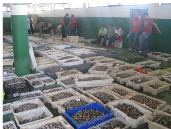
Skaldyrsauktion i Caril

lillamalede vinduer og borde og udsigt over byens badestrand og havnen.