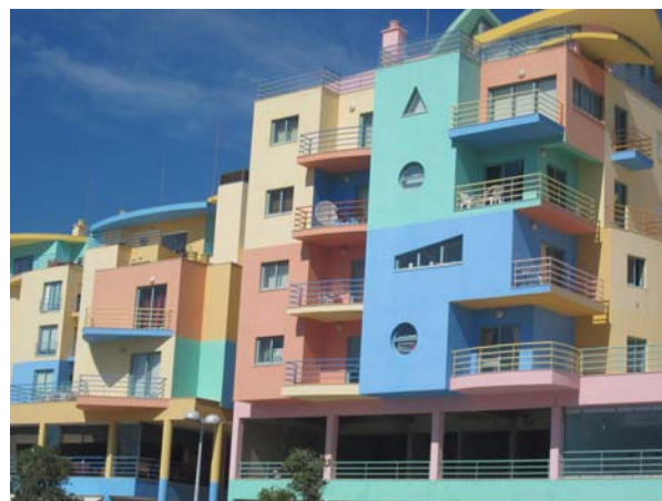
Lego-husene der omgiver marinaen i Albufeira