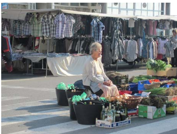
Vi fik suppleret vores forsyninger med aguadiante