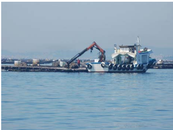
Blåmuslingeopdræt i Rio Arosa