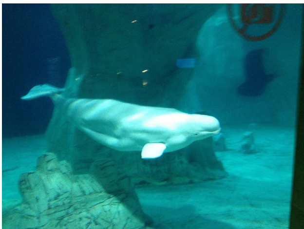
En beluga! Det er et stort akvarium når der kan være flere belugaer. Oceaniet i Valevicia

tomme. Havneområdet er virkelig udbygget, men det er en lidt stille form for liv, der er her. Der er masser der går ture, løber, cykler, løber på rulleskøjter og bruger de legepladser der er. Legepladser både for børn og voksne med udendørs træningsredskaber. Vi syntes gadeforløbet i området var lidt rodet, indtil det gik op for os, at der i området indgår dele en Formel 1 bane! Altså her i havneområdet og den nærmeste bydel køres der en gang om året Formel 1 løb. Så lukker man en bro over havnen, flytter en masse blomsterkasser og flytbare pæle og fyrer den af. Derefter reetablerer man det gadeforløb, der fungerer resten af året. De arealer, der så ikke indgår i gadearealet bruges så til at løbe på rulleskøjter på og de unge øver sig på deres skateboards. Ja, og det ser ud til at virke! Nu hvor det ikke ser ud til at der skal sejles Americas Cup her mere, er marinaen blevet omdøbt til Marina Real Juan Carlos I.