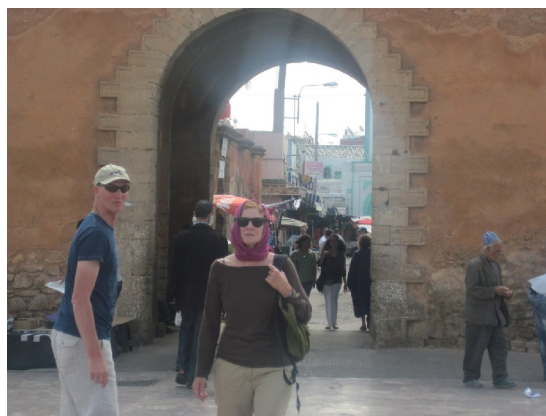
Indgangen til Medinaen i Muhammedia

vi den og forberedte ham således til turen til Casablanca.