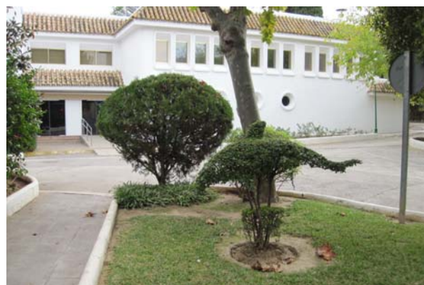
Indgangen til sejlkubben, med vores svømmehal i baggrunden

Først lidt om vores umiddelbare omgivelser: Sejlklubben ligger i gangafstand fra centrum med domkirken og Alcazar, det gamle slot. Der tager ca. 20 minutter at gå derover og det er ikke en særlig spændende tur, men det er langs floden og gennem en park (Maria Louisa). Det er dejligt at gå til centrum og gå rundt og se på folk og bygninger. Vi gør det desværre ikke så tit som vi havde troet.