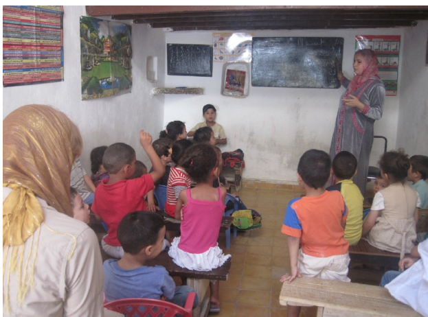
I skole i Fez, Vi terpede alfabetet og tallene