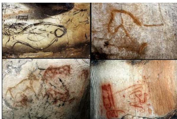
Cuevas de Pilates

Da det var på plads, pakkede V&R bilen og tog på en todages udflugt til Granada og Cordoba. De havde bestilt billetter til Alhambra den 29. marts om eftermiddagen. OG SÅ... ja så viste det sig at der var generalstrejke den dag. Mange af de offentlig ansatte har ikke fået udbetalt deres løn i op til to og en halv måned, så de gik i strejke. Vores forskellige kilder var usikre på, hvordan situationen ville være ved Alhambra, men de tog af sted og lavede lidt luft i planen. Nu hvor de ikke skal nordpå, så er der mulighed for lidt elastik i planerne.