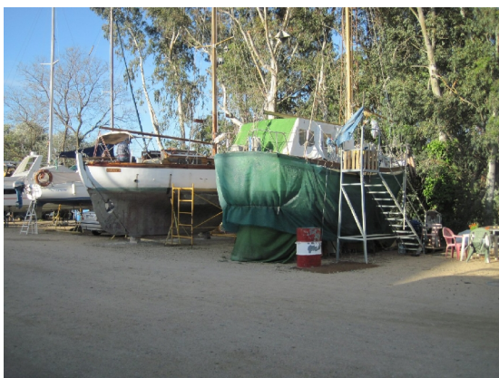
Pladsen i Gelves, som var vores hjem et par uger, et rigtig rart sted