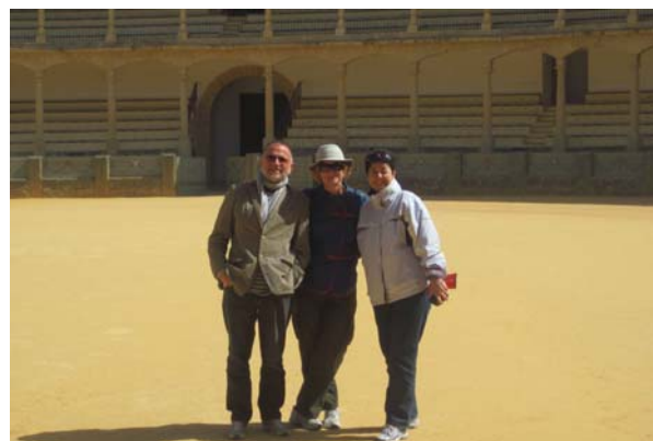
Tre matadorer i tyrefægtterarenaen i Ronda