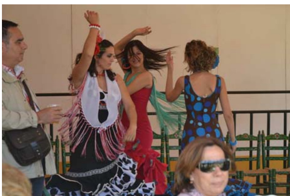
Der blev danset sevilliana til langt ud på natten

Det var selvfølgelig helt vemodigt at skulle fra Sevilla, men når det har været planen gennem en hel vinter har man ligesom vænnet sig til tanken. Det er også nødvendigt at komme videre. Det var så mandag den 30. april om aftenen, at det passede med en bro-åbning og et kommercielt skib der skulle gennem slusen at vi kunne komme ud. Det var klokken halv ti om aftenen at vi smed fortøjningerne i Club Nautico. Brogennemsejlingen og slusningen gik efter planen og vi var i Gelves klokken halv et. Tidevandet var på vej ind, så vi sejlede ind i havnen og lagde os til. Vi havde været i radiokontakt med havnen, men han forstod ikke det med, at vi kun stak 80 centimeter, så han var lidt overrasket da vi lå inde i havnen. Det er ikke ret meget vand og ved lavvande er der faktisk bare mudder.