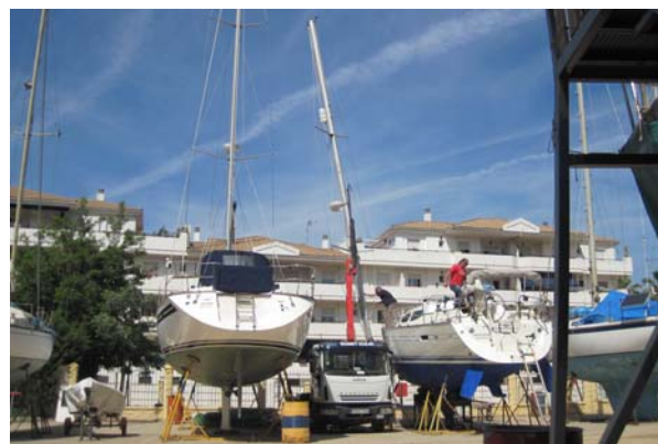
På land; mastekranen er kommet