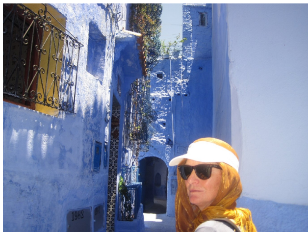
Chefchaouan som vi besøgte på en dagtur fra Smir, alle væggene i medinaen er malet i lys blå og hvidt