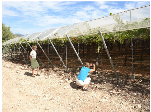
Vi havde set det fra havet, store områder, dækket af plastik. Her dyrkes der vin under plastik.