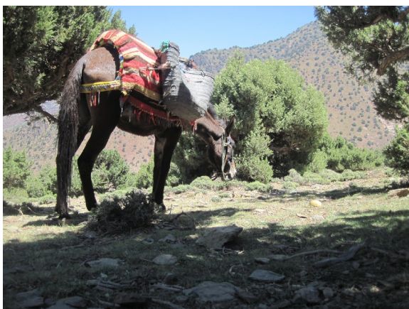
Muldyret, vores tro følgesvend i to dage, bar vores oppakning og mad

Ved fire tiden var vi i Tizi Ousseem, der ligger i 1.800 m, hvor vi skal overnatte. Det er ikke samme standard som i går nat, men der er en madras på gulvet, en hovedpude og alle de tæpper vi vil bruge. Muhammed lavede en grøntsagstahina til os, og Sten kiggede ham selvfølgelig over skulderen for at lure ham fidusen af. Dagens tur var på 14 km og igen med 600 meters højdeforskel.