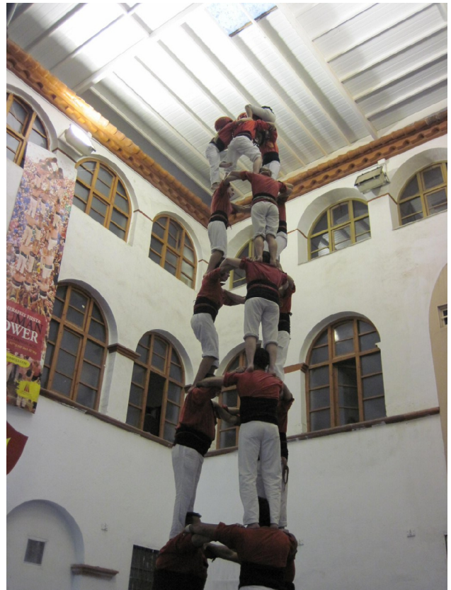
Den sidste etage er på vej op, en pige på 7-8 år iført styrthjelm og tandbeskyttere

Vi kom så endelig fra Tarragona klokken tyve minutter over ni denne mandag morgen. Når vi endelig skulle være blæst inde et sted, så var Tarragona et fint sted at være. Vi var i Genista klokken fire. En begivenhedsløs tur for maskine. Marinaen er der heller ikke noget at skrive om. Ifølge vejrudsigten ser det ud til at vi kommer til Barcelona i morgen.