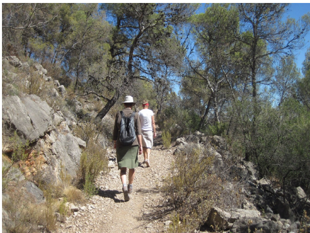
Nationalparken Sierra de Espuna

skulle lige vænne os til at de asfalterede veje, var nogle meget tynde- næste usynlige striber på kortet, at de asfalterede stier, var svære at se og at muldyrstierne var trukket op med en meget fed linje.