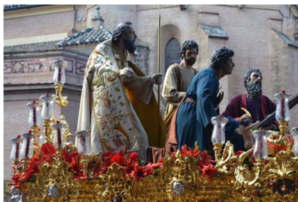
En paso på vej gennem byen til katedralen

Endnu en dag med en tvivlsom vejrudsigt. Det lod vi os ikke distrahere af og tog ned til den gamle cigaretfabrik, ved hvis kapel processionen Las Cigarerras (tobaksarbejdernes broderskab) skulle afgå. Vi stod ved Juan Sebastián el Cano og så de fint påklædte mennesker. I dag er det jo Skærtorsdag og man, kvinderne er i sort med mantilla og sorte kniplinger på, meget elegant. Det blev dog endnu en skuffelse: dårlig vejrudsigt, ingen procession!