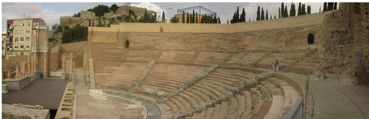
Det fint restaurerede romerske teater i Cartagena er en integreret del af det historiske museum

Sidder på kontoret igen. Og som det er blevet en sædvane, ligger vi og hugger i fortøjningerne her efter frokost. Sten synes ellers det var køligt i morges da vinden stod stille og det var 20 grader. Og så er det for første gang sket, at jeg har mistet et par dage i cyberspace. Jeg kan ikke har fået gemt dokumentet ordentligt, så der er lige røget to dage, men det er ikke vanskeligt at huske, hvad vi har foretaget os. Egentlig syntes jeg da vi kom her til Torre Vieja i lørdags, at det her var lige lidt for turistet til, at her var rart. Men her efter weekenden er ovre, og der er kommet liv i gaderne, så ser her mere venligt og normalt ud. Men turisterne fylder meget, og det er ikke unge mennesker. Argh.. hvor vi hugger i