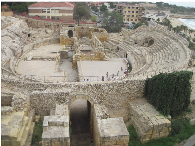
Imponerende arena uden for Tarragona

tid, blev dette til et fint lag rødt mudder (det er det fænomen meteorologerne kalder blodregn og som I vist også har oplevet i Danmark i disse dage om end med mindre intensitet end her). Med vores erfaringer fra Rabat, hvor båden også blev dækket af et sådant lag ørkensand, vidste vi, at det ikke skulle have sol, for så at blive