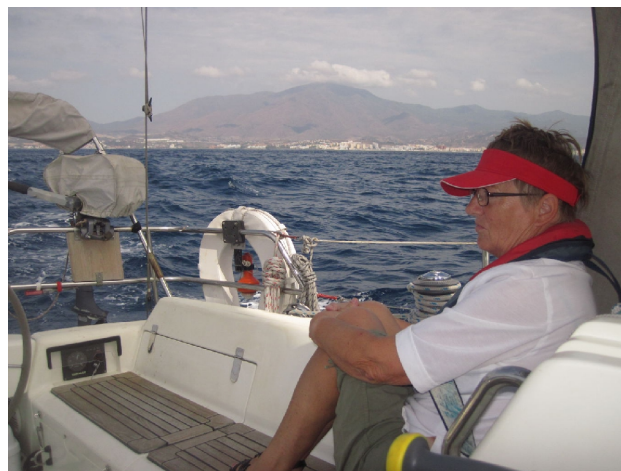
Dejligt at være på havet igen, Costa del sol