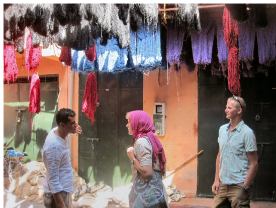
Farvernes souk, tørklæder, garn i alle regnbuens farver

at få pengene til at trille ud af tegnebogen. Her er mange dejlige ting og gode ting. Men man skal have øjnene med sig.