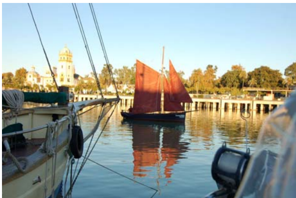
Usigten fra vores cockpit i Club Nautico Sevilla