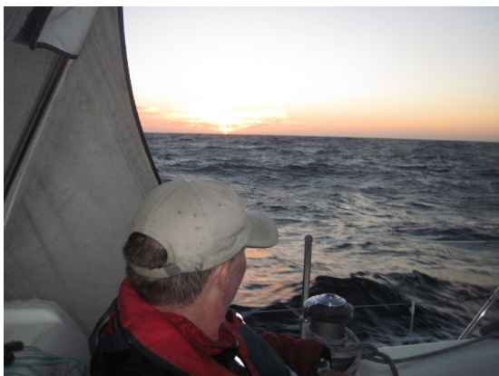
Årets første tur, dejligt at komme på havet!

Det passede fint med højvandet og afgangstidspunktet. Vi skulle fra Gelves 1,5 time før højvande, hvilket passede med klokken halv ni. Vi fik så en start med lidt modstrøm, men det var til at leve med. Det var en tur for maskine, for der var ingen vind, så det blev også en rimelig lun dag. Vi var i Chipiona klokken halv fem. Vi fik vist Niels storke langs vandkanten, og også de der havde bygget reder i toppen af træerne.