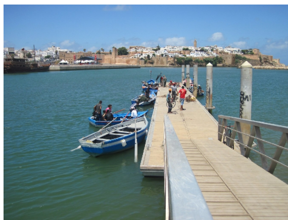
Færgefarten fra Sale til Rabat

Vi gik os en tur om eftermiddagen, for at udforske det lokale supermarked. Det har faktisk et meget stort udvalg, så vi kommer ikke til at savne noget. Vi har fundet en af de lokale bagere, han bor lige inden for den nærmeste port til medinaen i Sale. Dejligt friskbagt brød hele dagen, nogle gange skal vi vente et par minutter til det bliver færdigt. 80 øre for et frokostbrød, der rækker til os begge.