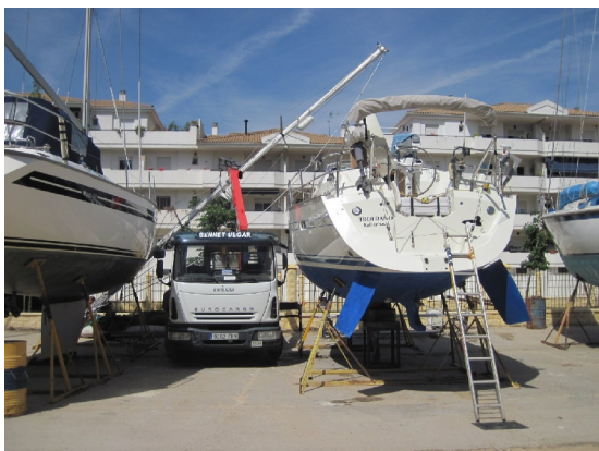
Masten tages af