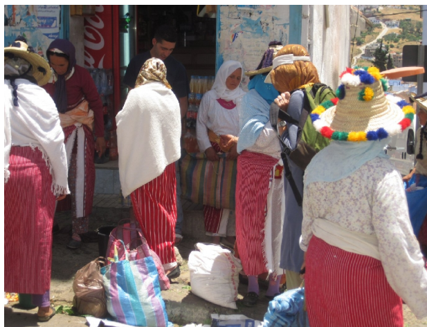
Markedsdag i Chefchaouen