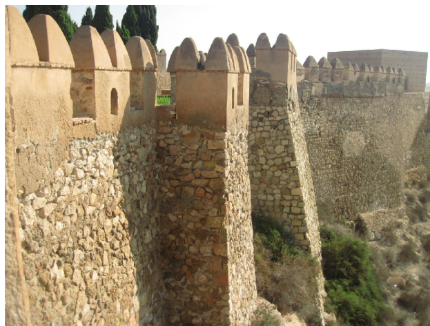
Muren omkring Alcazaba er imponerende

var også en fin tur gennem den gamle bydel ned til byens centrum, hvor vi var blevet anbefalet en tapasbar af pigerne på kontoret i marinaen. Der fik vi en øl og tapas, men denne gang blev vi ikke hængende, men gik lidt rundt indtil vi fandt et sted hvor vi tog dagens menu. Derefter slentrede vi lidt rundt og fandt en taxa som bragte os tilbage til Aquadulce.