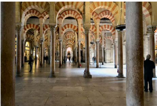
Der er meget tilbage af den arabiske moske i Mezquita-Katedralen

var planen klar: Huerta del Albalá på bodegavesøg, Ronda for at se på byen som ligger på begge sider af en meget dyb kløft, for at køre videre til Cordoba og overnatte og se Mezquita-Katedralen næste dag. Det er interessant at se disse andalusiske byer, som bærer præg af en meget turbulent indvandrer historie. Først de kristne germanske stammer, jøderne, araberne og endelig den kristne igen efter generobringen. Der er rester af dem alle over det hele.