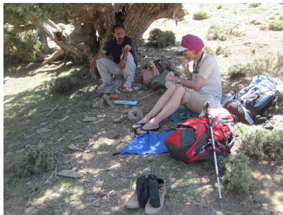
Frokostpause i Atlasbjergene