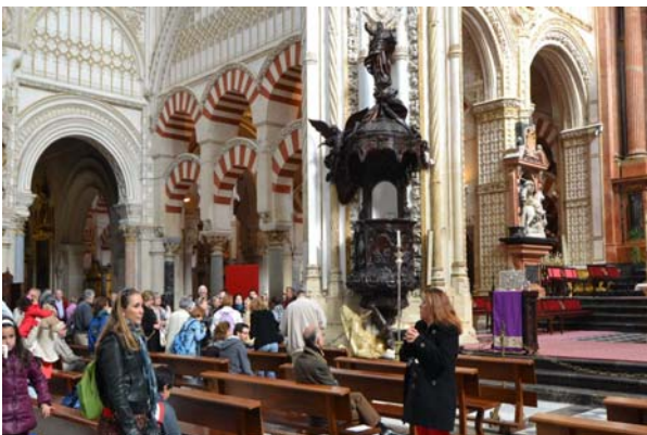
Og så er der bygget en katedral inde midt i Det er et kæmpe bygnings værk, og inde i Mezquita-Katedralen er der en udgravning der

I Mezquita-Katedralen (moske-katedralen), kan man se det hele på samme sted. Omkring år 800 byggede kaliffen en moske på stedet. Den er blevet udvidet tre gange, og efter den kristne generobring er der blevet bygget en katedral inden i moskeen.