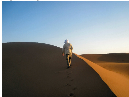
Solnedgangstur i sandørkenen