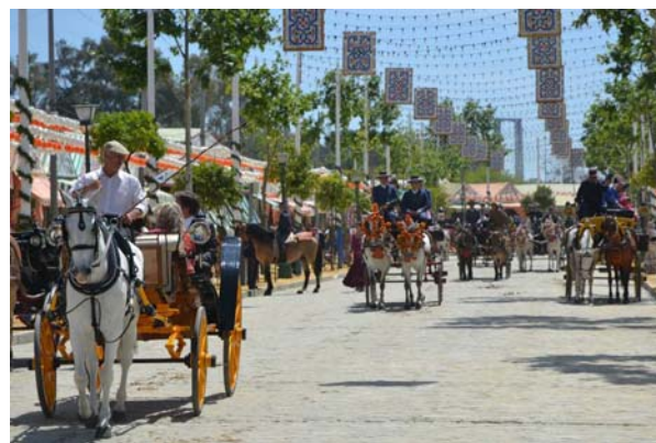
En af måderne at ankomme til feriaen på er i hestevogn

I år startede Feriaen natten mellem mandag den 23. og tirsdag den 24. april, med at lysene på pladsen blev tændt. Altså feriaen startede ikke rigtig, for man havde ikke sit festtøj på, men alle cassetterne blev åbnet, så der blev spist, drukket og danset. Det der drikkes mest af, er rebuchitos. Det er is, manzanilla sherry og seven-up! Ca. en tredjedel af hvert. Da vi hørte om blandingen, blev vi meget bestyrtede. Men det fungerer! Og det er nok godt, at man ikke drikker vin døgnet igennem den uge feriaen varer. Og så danses og synges der Flamenco i alle cassetterne. Det vil sige at her i byen danses der selvfølgelig den lokale udgave Sevilliana, som alle kan.