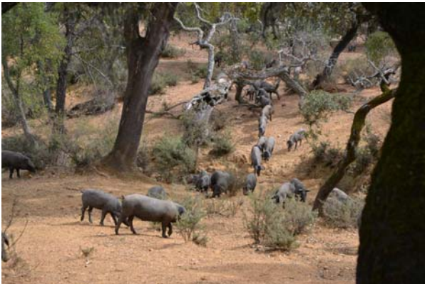
Sortfodede grise i bunden af egeskoven