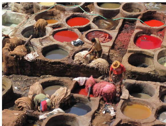
Garvernes souk i Fez

Vi vovede os ind i souken og fandt et sted, hvor vi fik morgenkaffe og pandekage med hhv. flødeost og honning. Her er fest, farver, dufte, lugte og masser af mennesker. Her i Fez er motoriseret transport forbudt i Souken, så det er æsler og muldyr, der transporterer gods og varer frem og tilbage.