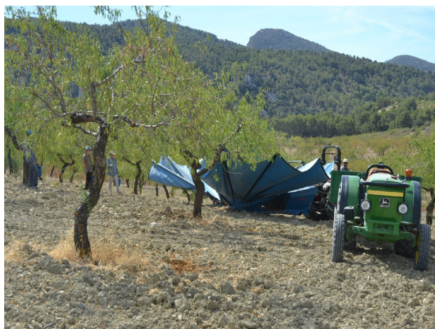
Der høstes mandler: maskinen folder en paraply rundt om træet, ryster så træet; maskinen folder paraplyen sammen og tømmer den ned i en lastbil.

Vi nåede ikke at se domkirken i går, lige da vi kom til den, lukkede de dørene, men vi var klar her til morgen. Det er en meget flot kirke og byen bærer helt klart præg af at være regionshovedstad, om end for en lille region. Vi skulle aflevere bilen inden to, men havde heldigvis tid til at køre ud til Mar Menor som er Murcias svar på Ringkøbing Fjord. En aflukket fjord kun med gennemstrømning ind og ud to smalle steder, og derfor med stillestående vand, som i dette klima skulle holde de 26 grader året rundt.