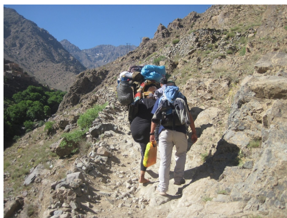
På vej op i Atlasbjergene, ad muldyrspor

frokost i nærheden. Det var som sædvanlig lettere at gå ned end op, men jeg bliver altid nervøs for, hvordan mine lår har det dagen efter. Da vi nåede ned til Mzik i 1.800 meter udførte vi en række strækøvelser for at prøve at forebygge problemer i morgen. Det var et rigtig flot sted, vi skulle overnatte. Stort værelse badeværelse med bruser og rigeligt varmt-koldt-varm-koldt vand. Flot tagterrasse med udsigt over bjergene og fint opholdsrum og spisestue. Som vanen er, blev vi budt på myntete og små søde kager, da vi ankom og vi havde knapt nok drukket den første kop før vi faldt omkring-kuld i det pæne opholdsrum.