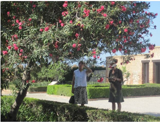
Alcazaba i Almeria