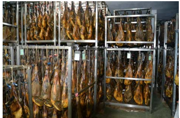
Iberiske skinker af sortfodssvin

I Almonaster Real, var der endnu et eksempel på en moske som de kristne lavede om til en kirke, ikke ret stor, men netop derfor facinerende. Man kan stadig se stedet, der angiver retningen mod mekka. Der er virkelig mange befolkningsgrupper der har præget Spanien i tidens løb.