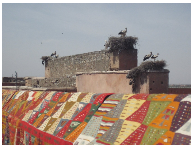
Udsigt over tagene i Marrakech med tæpper og storke