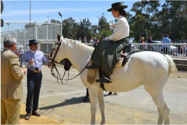
Man kan også bare ta' sin egen hest og ride til fest