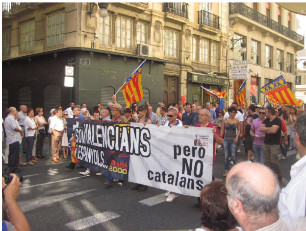
Vi er valencianere, spaniere, men ikke catalanere