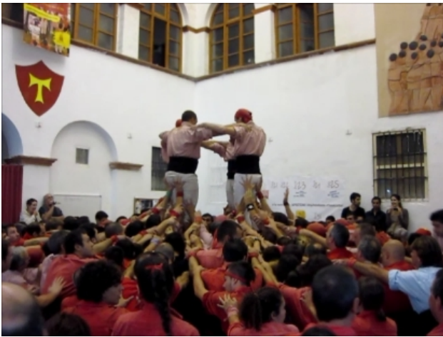
Første etage er på plads, anden etage er ved at etablere sig.

Bygningen af pyramiden er ikke afsluttet for den er succesfuldt demonteret. Vi nåede at se tre pyramider. Det var en speciel oplevelse. Man tog det meget alvorligt og vi kom i snak med nogen, der forklarede, at der er konkurrencer og mange hold der konkurrerer. Det var en lokal sag, der var meget få turister tilstede.