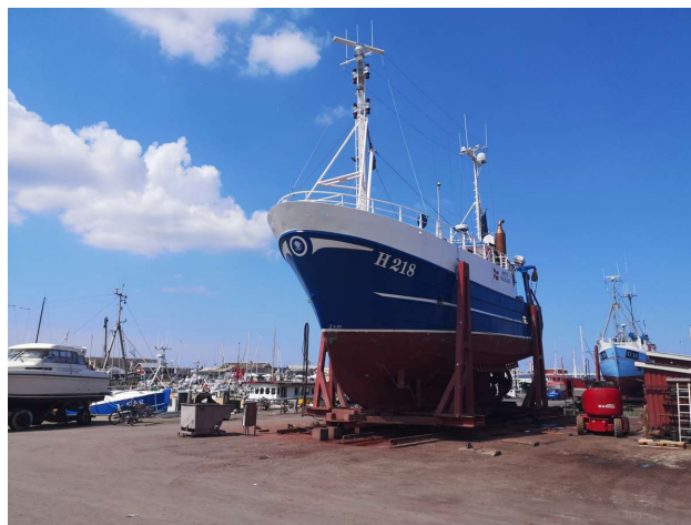
Gilleleje er stadig en aktiv fiskeriby med værst

Optimistiske som vi var satte vi sejl ved afgang fra Gilleleje. Det gik også fint ....på plat læns, spilet genua og solen i ryggen... knapt to timer, så måtte vi starte maskinen. I Rørvig fandt vi en langskibsplads i færgehavnen, hvor var masser af pladser til lystbåde.