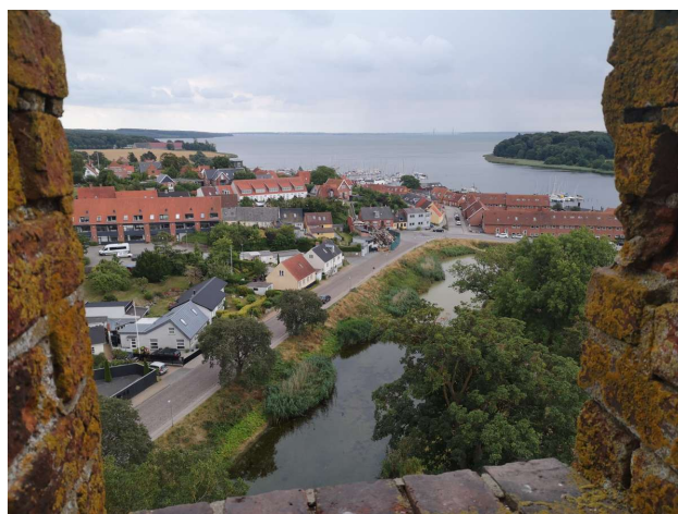
Udsigt fra Gåsetårnet i Vordingborg

Og jo det blæste halv kuling fra vest, så vi havde to urolige nætter, hvor bølgerne bankede lige op under hækken, - ikke noget der plejer at genere os, men vi havde fået placeret os uheldigt i forhold til vinden.. øv!