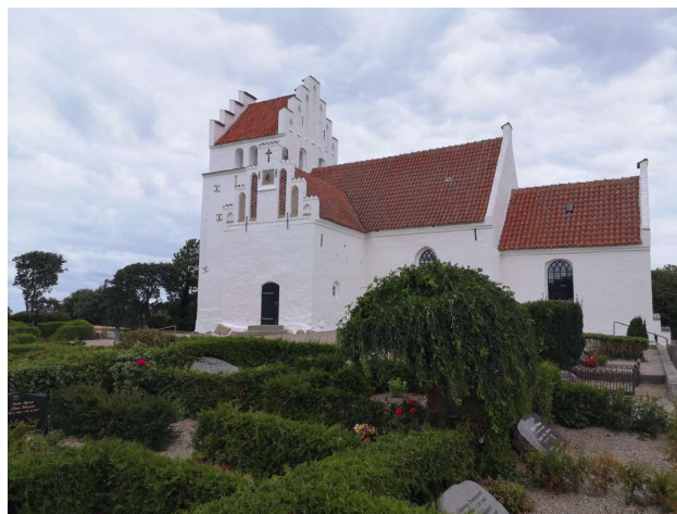
Kirken på Sejro