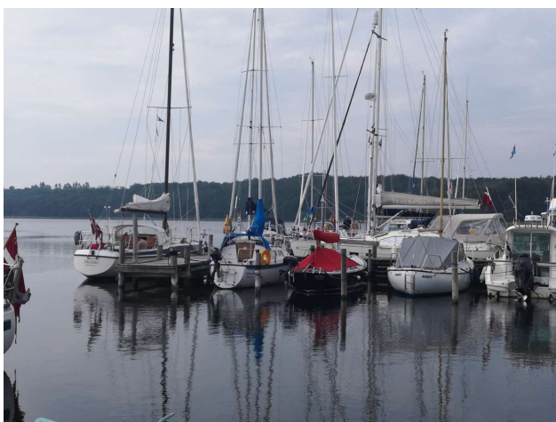
Bisserup, hvorvi mødte Maxine fra SKK

Den smule vind der var - var i mod os, så det blev til maskinsejlads. På vej sydpå så vi marsvin, det bliver man glad i låget af! Da vi skulle rundt om pynten ved Bisserup blev vi udfordret af en hel del bundgarnepele, men kom rundt.