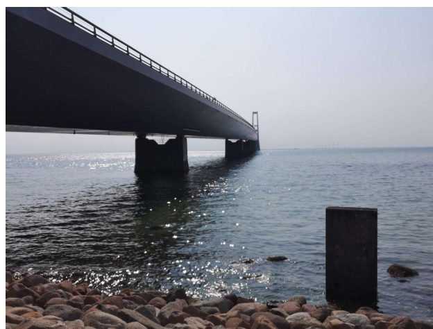
Storebæltsbroen fra en lidt anderledes synsvinkel

eller to sten. Helt ærligt, vi blev lidt forskrækkede, men kom da over det. Senere studier af søkortet viste da også en 'grund' på bare 2 meter; men med vores køl er man måske knapt så forsigtig som burde være. Øv.