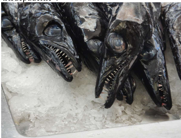
Fiskemarked i Funchal (peixas-espada=kårdefisk)

Altså: hvis nogen tror det er lettere at gå i en by end i naturen så må de tro om igen, efter sådan lang formiddag med rundvisning, frokost og shopping i Funchal... ja så var vi ømme i "trædepuderne".