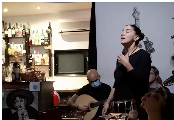
En super aften (med Fado) i Funchal

Hele familien sang og også personalet, fra barnebarn til bedstemor. Mor sang mens hun serverede, Tjeneren tog en pause fra serveringen og sang, guitaristens niårige datter sang, bedstemoren kom ind fra køkkenet og sang,... helt forrygende. Virkelig et sted med atmosfære.