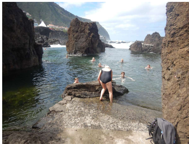
Porto Moniz og badetur i en "klippe-pool"

tværs over øen over øens højeste punkt. Endnu en gang blev vi imponerede over de KÆMPE infrastruktur anlæg der er overalt på øen: Igen masser af broer og tunler. Kørte til nordkysten Sao Vicente og så mod vest til Porto Moniz. Videre mod nord til Levada do Ribeira Janela, hvor vi blev sat af bussen og gik godt fire kilometer ind langs levadaen Lamaceiros. På grund af sammenstyrtinger kan man for øjeblikket ikke gå længere ind men vi havde en meget fin tur, hvor vi gik tilbage samme vej. På vej til frokost standsede vi i Porto Moniz, hvor vi fik mulighed for en badetur i en "klippe-pool" det var ok,- men koldt, men sjovt at opleve, Ligner lidt det vi tidligere har prøvet på Azorerne.