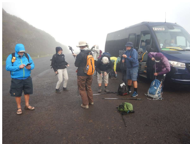
Fremme ved startstedet for vores førstevandre tur ..... i tåge og regn

Formålet var at bringe vand fra den vestlige og nordvestlige del af øen til den tørre sydøstlige del, for at understøtte bebyggelse og landbrug, eks sukkerrør. De også tidligere blevet brugt af kvinder til at vaske tøj i områder, hvor rindende vand i hjemmene ikke var tilgængeligt. De seneste blev lavet i 1940'erne. Da Madeira er meget bjergrigt, må det have været svært at bygge levadaerne. Vi kunne se at mange er skåret ind i bjergsiderne, og det har også været nødvendigt at grave ca. 25 kilometer tunneler til levadaerne. Man kan kun blive forundret over det ingeniørarbejde, der ligger til grund og den enorme arbejdsindsats der ligget bag.