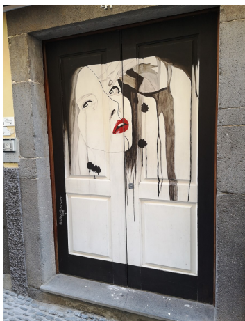
En af de mange fine døre med malerier (Funchal)

og jeg gik på jagt efter noget af det stof som pigerne der sælger blomster på markedet bruger til deres nederdele. Det er ret kulørt...meget kulørt.. og stribet. Jeg fandt noget og købte så halvanden meter af det.