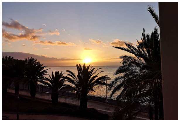
En sidste solnedgang fra balkongen på vores hotel i Santa Cruz

kan klare; og tror hun der er problemer bag hende på så kommer hun. Og ikke at forglemme, så er hun godt forberedt. Håber vi fik takket hende, for hun var med til at få turen til at være en rigtig god oplevelse.