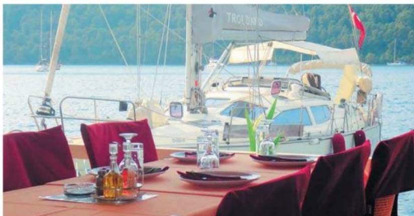
Fortøjet ud for lille taverna i Polače på Otok(øen) Mljet. Bordet er dækket og klar til os.

For at fuldende billedet skulle hele processen så gentages i omvendt rækkefølge, da vi senere forlod Kroatien med kurs mod Italien. Jeg troede naivt, at nu hvor vi var indklareret lovligt og altså kunne bevæge os frit hen til havne- og paspolitets kontorer, måtte dette vel være tilstrækkeligt til at udklarere; men nej vi måtte lette anker og sejle hen til udklaringskajen, have stævnankeret ud og bakke og fortøje mens vi fik stemplet papirerne samt betale for opholdet ved udklaringskajen. Da jeg forsigtigt forsøgte at sige, at det måske var at overdrive lidt, fik jeg blot at vide, at det da var helt naturligt, at man skulle stille ved "grænsen", når denne skulle passeres, og de 13 euro jo var betaling for den hjælp, vi havde