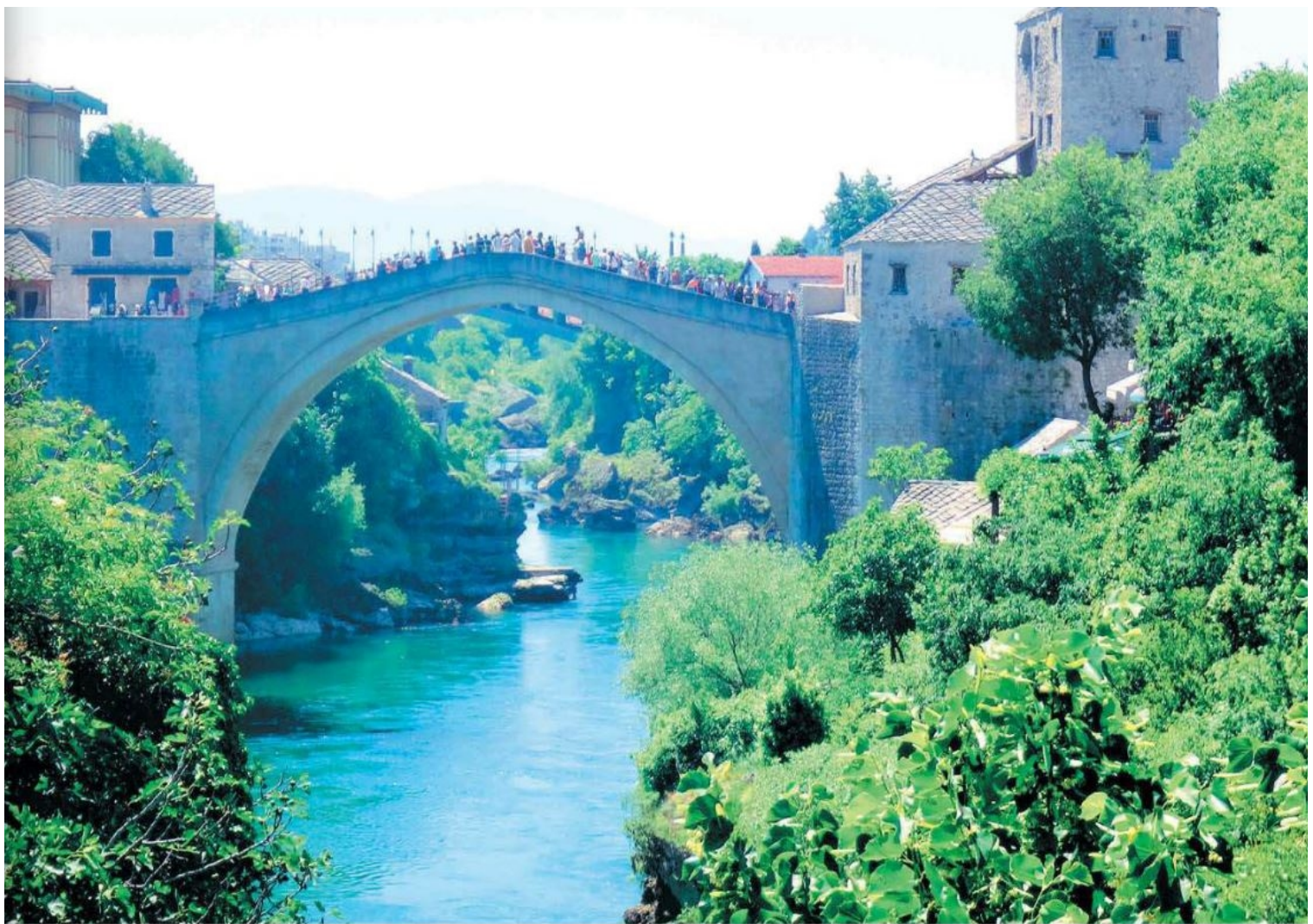
Broen i Mostar (Stari Most = Den store Bro), der forbandt den bosniske og -kroatiske del af byen, og som altid har været et symbol på fællesskabet. Den blev ødelagt under borgerkrigen, men er nu genopbygget.