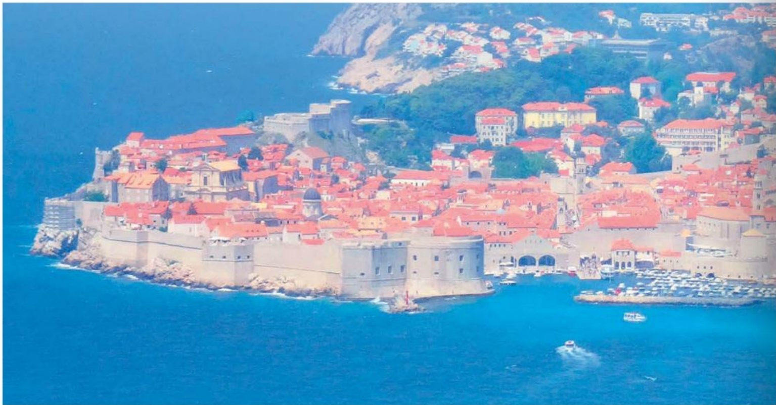
Dubrovnik, Adriaterhavets perle og på UNESCO's liste over verdensarv. Nok et besøg eller to værd; men helst en dag, hvor der ikke er for mange cruise-skibe.