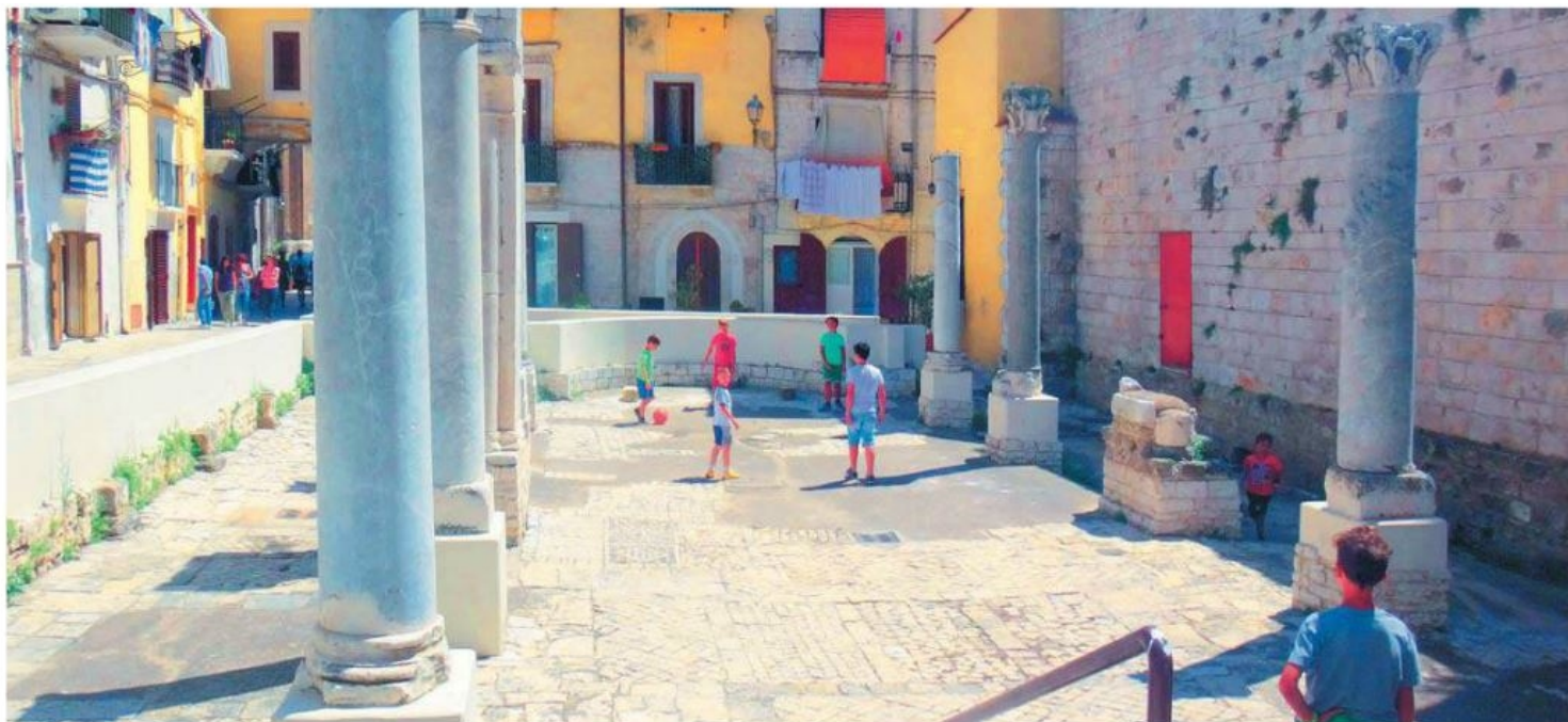
Antikke ruiner overalt, her anvendt som fodboldbane.