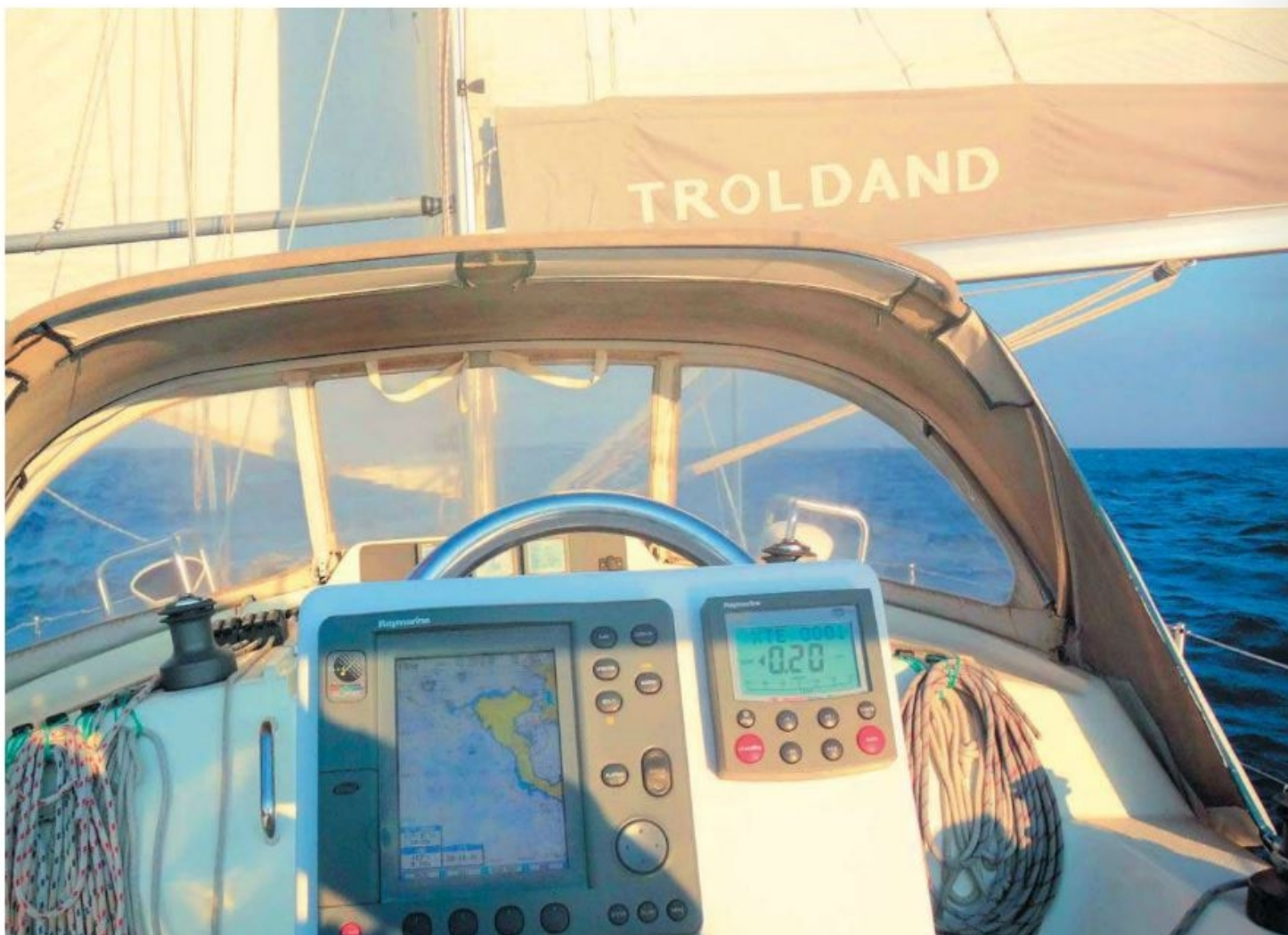
På vej sydover fra Brindisi til Lefkas: 170 sømil og 29 timer. Her for sejl og med autopiloten ved roret.

med fire forskellige religioner og med vidt forskellig udvikling. Samtidigt havde vi fået en fascinerende tour de force i Europas historie og en dybere indsigt i forskellige bureaukratiers vidunderligheder. Og det i en verden, hvor vi næsten havde glemt, at man skulle bruge pas...men hvem ved, måske skal vi til at vende os til det igen?