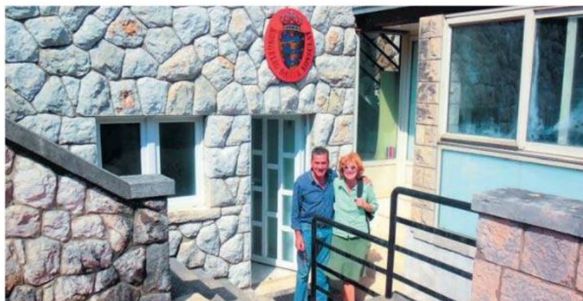
På det danske konsulat i Dubrovnik for at afgive vores stemme i forbindelse med folkeafstemningen om retsforbeholdet. Den venlige honorære konsul med Rie.