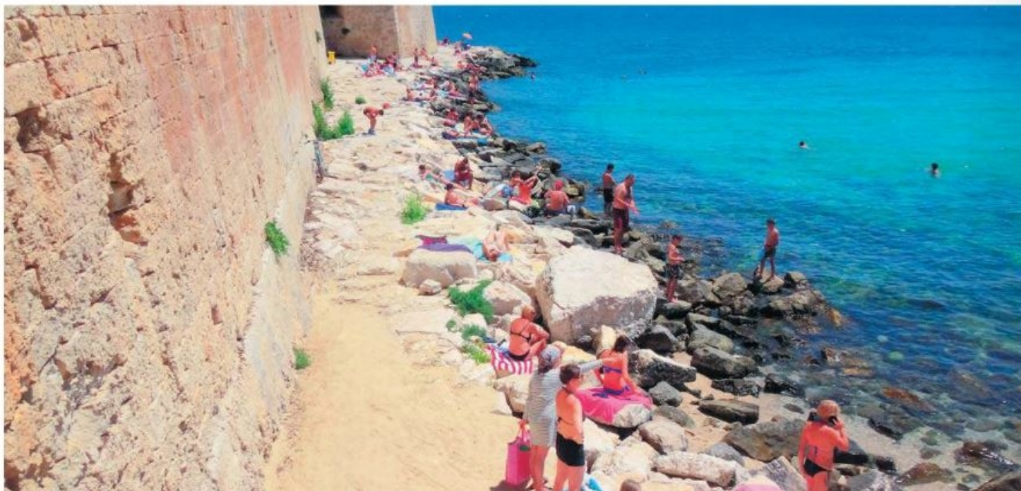
Lokale badende uden for bymuren i Monopoli.

for Paxos. Men så var det også slut med vinden, der på blot en time forsvandt helt, så vi de sidste 35 sømil til Lefkas måtte have hjælp fra "jerngenueen".