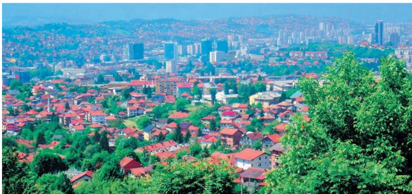
Udsigt over Sarajevo. Det var fra positioner som denne, at serbiske snigskytter konstant beskød civile bosniakker og kroater for at få dem til at forlade byen. Endnu en variant af begrebet etnisk udrensning

På turen nordover langs Adriaterhavets østlige kyster er Troldand nået til Montenegro. Den yngste af de ex-jugoslaviske forbundsstater, der blev selvstændigt så sent som i 2006. Her efterlades båden i sikker havn og i en udlejningsbil skal det indre af landet udforskes nærmere.