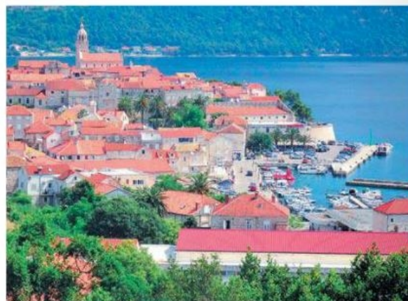
Korčula er et mini Dubrovnik men langt mindre hærget af turister. Det er i øvrigt Marco Polos fødeby.