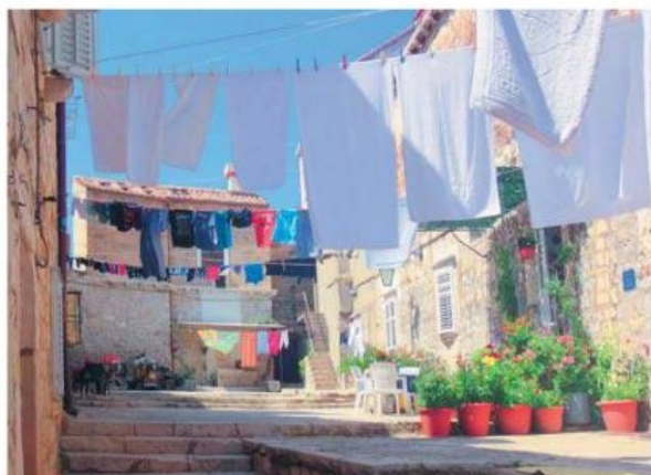
Baggård i Dubrovnik, det var helt velgørende ikke at se en souvenir bod.

På forhånd havde vi via e-mail korresponderet med konsulen, som lovede at være til stede, blot vi i forvejen meldte vores ankomst.