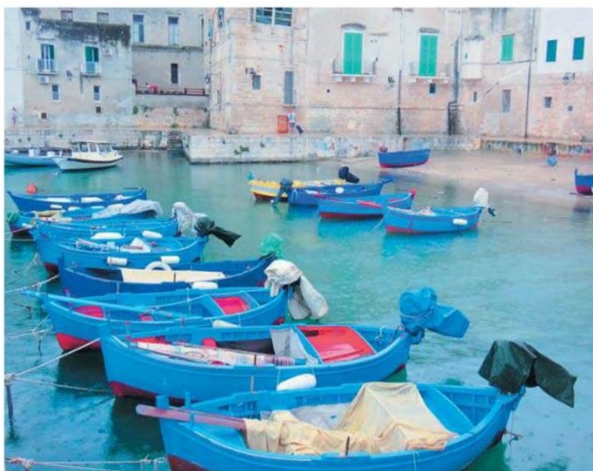
Bykajen i Monopoli (billedet er taget fra vores cockpitt).