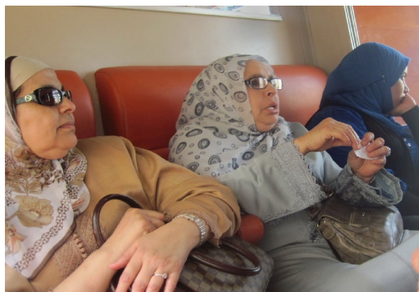
Vores nye veninder; inden de forlod toget var vi blevet inviteret på couscous hos dem.