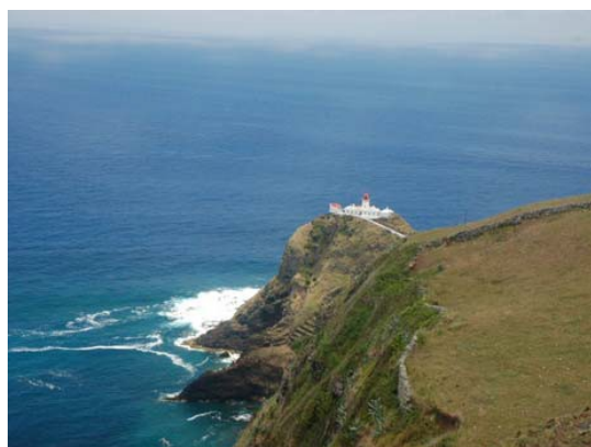
Fyret på den sydøstlige pynt af Santa Maria

Endnu en dag hvor vi lod os glide ind i Santa Marias stille og rolige levevis. Nogle gik op i byen om formiddagen for at se på markedet. Der er en lille markedsbygning med faste stader, hvor der sælges kød og fisk, men der var ingen grønsager i dag. Måske er det fordi der er byfest her over weekenden. Vi købte lidt til frokost, og spiste da vi kom tilbage til båden. Billedredaktøren var blevet færdig med billederne, og jeg gik i gang med at gøre den illustrerede dagbog færdig, så den kan komme på nettet. Vi har besluttet, at sejle videre i morgen, så den sidste aften her skulle jeg lave mad. Det blev til middag på Central Pub oppe i byen, hvor vi fik dejlig mad og øl.