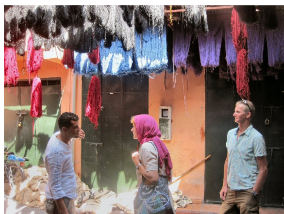
Farvernes souk, tørklæder, garn i alleregnbuens farver