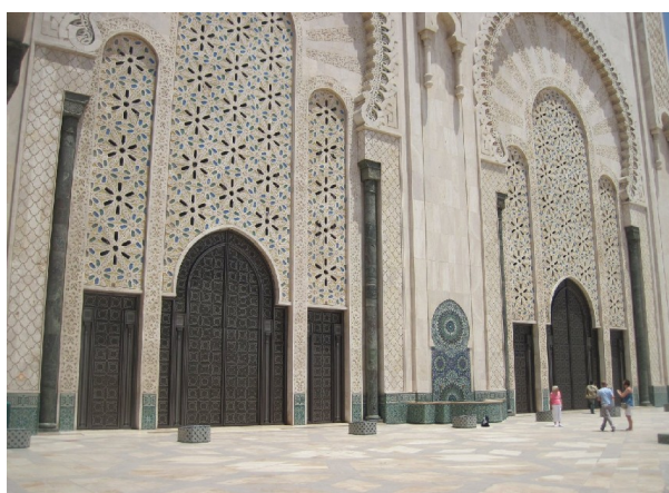
Det er svært at give et retfærdigt indtryk af Hassan den II moskeen. Dette er bare to af mange indgangsdøre

faktisk kan få adgang. Det er et imponerende bygningsværk med plads til 25.000 bedende og den tredje største moske i verden bygget over en periode på bare seks år og færdig i 1993. Det var interessant at se de arkitektoniske ligheder med de 1000 år gamle moskeer vi havde set i "El Andalus"; men om det skal tolkes som kontinuitet og tradition eller mangel på udvikling er jo et interessant spørgsmål. Rundvisningen kunne vælges på arabisk, fransk, spansk, tysk eller engelsk (hvilket sidste vi naturligvis valgte). Det undrede os en del, at der i vores gruppe var en (i øvrigt meget yndig) yngre dame med tørklæde og tydeligt af mellemøstlig herkomst... jeg kunne naturligvis ikke nære mig og forsøgte (det var ikke svært) at komme i kontakt med hende. Hun utroligt sød og fortalte at hun var turist fra Jordan på et fem dages besøg, men da hun ikke kunne ikke forstå marokkansk arabisk valgte hun den engelsksprogede rundvisning. Jeg havde insisteret på at se den del af byen som franskmændene byggede ud i kolonitiden. Den skulle være præget af Art Deco bygninger. Det var den også, men de var meget dårlig vedligeholdt og en del af dem var revet ned, så det var lidt af en skuffelse. Vi sneglede os gennem byen tilbage til stationen for at tage tilbage til Muhamedia.