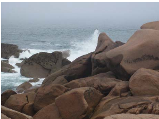
Den røde granitkyst er virkelig rå og flot (og det her er i stille vejr!)

granit klodser). Vi spiste frokost i land. Vi fik den lokale specialitet: galetter med fyld. Galetter er pandekager lavet med boghvede.