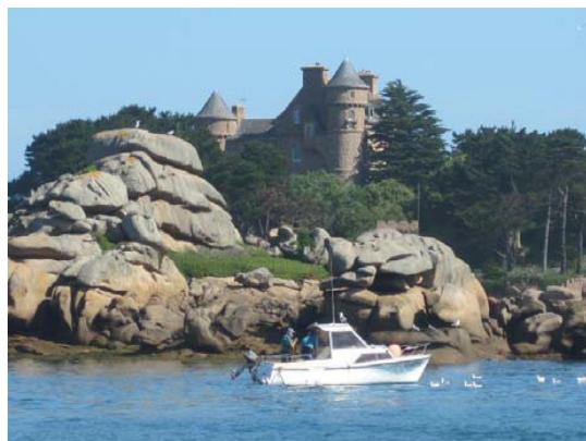
Det var en ret flot indsejling til Pluminac'h. Slottet i baggrunden er i øvrigt en del af Leif Davidsens roman: 'Ravnens Rede'