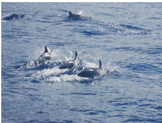
Der var ingen hvaler men masser af legelystne delfiner

Vi var tidligt oppe og ovre ved hvalsafaribåden klokken ni. Det var fint vejr med fin sigt, så vi var forventningsfulde. Det var en katamaran, der sejlede hurtigt, så det var godt vi havde ekstra trøjer med.