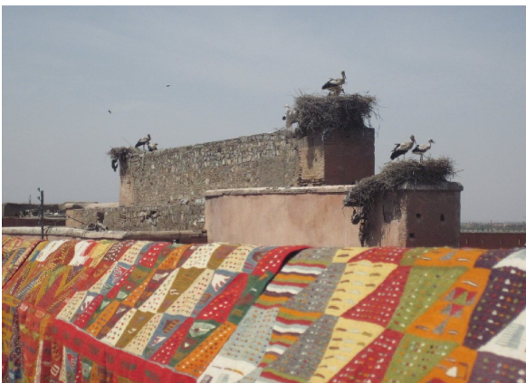
Udsigt over tagene i Marrakech med tæpper og storke