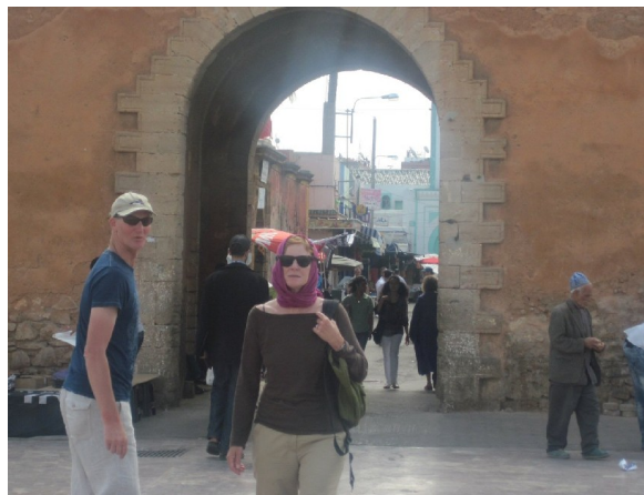
Indgangen til Medinaen i Muhammedia

ikke havde set filmen Casablanca med Humphrey Bogart og Ingrid Bergman! Vi fandt den frem af Stens efterhånden meget righoldige lager af film, og om aftenen så vi den og forberedte ham således til turen til Casablanca.