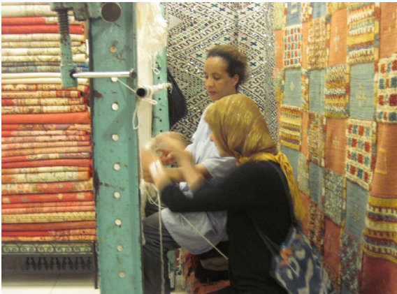
Jeg er ved at knytte et tæppe

maden, idet det som sagt ikke er noget problem med at tage vin med på hotellets restaurant.