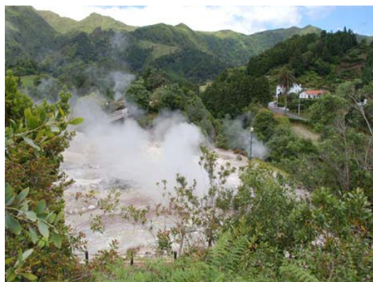
Jorden ryger og søerne og vandpytterne koger på Saõ Miguel