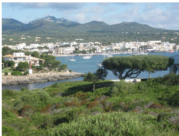
Udesigt over ankerpladsen ved Porto Colom

dampet af sidst på eftermiddagen, var der stille og meget hyggeligt på baren. fredeligt. Med hensyn til strømmen der forsvandt, er det pt. ok men vi er overbeviste om at der er noget galt med jordingen.