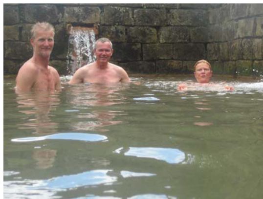
Varme kilder var virkelig noget vi kunne bruge: 40 grader varmt, lækkert for vores mishandlede muskler.