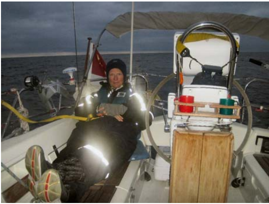
Rie på vagt klokken seks om morgenen

havde været på ration på turen: en letøl pr. person pr. dag. Vi havde slet ikke drukket vores ration, kaffeforbruget var heller ikke så stort som beregnet, for vi havde drukket meget vand!