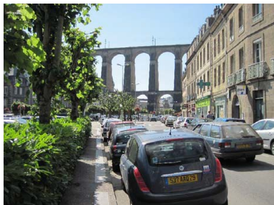
Morlaix skyline er præget af en høj jernbanebro bygget i 1870'erne

Morlaix kan man tage TGV'en der går direkte til Gare Mont Parnasse. Og så var der dømt: arbejdsdag! Vask, storindkøb og kontor-arbejde. Det sidste blev der ikke så meget af, da vi ikke kunne komme på nettet her. Men vask og indkøb blev overstået i fin stil.