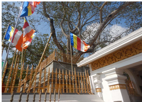
Templet med det hellige bodhi træ (der må understøttes)

Næste gang vi standsede, var i et kæmpe tempelområde, og vi så vi nogle af verdens største stupa monumenter, buddhismens hellige symbol.