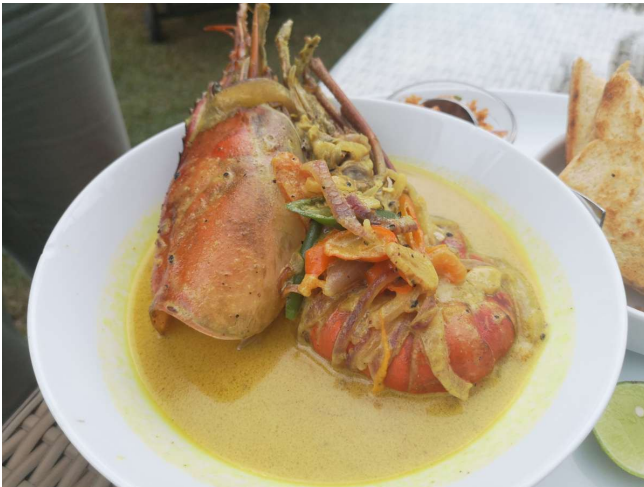
Kæmpereje til frokost

"Fridag" her ved stranden og der var mulighed for at tage på hvalsafari; vi takkede høfligt nej. Havde brug for en dag uden programpunkter. Men vi fik da både svømmet i havet og i poolen. Nød også frokosten ved poolen hvor vi hver fik hver en reje i karry. Kæmpe rejer fanget i den nærliggende Madu-flod.