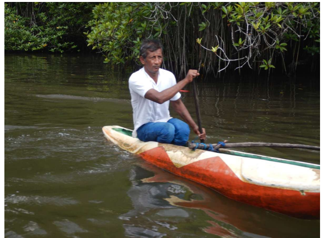
Lokal på Madu floden

Så startede turen hjemad: det bliver en lang dag. Heldigvis skulle vi først tjekke ud klokken tolv, og der var afgang lidt over et. Først var vi på bådturen op ad den brede Madu-flod til Madu Ganga Wetland et stort Mangrove område.