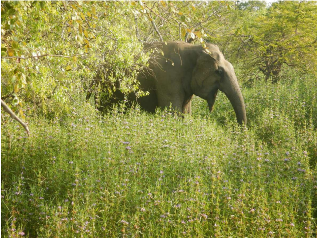
Enlig (i junglende frit omstrejfende) hanelefant ..... en runkedor?

krokodiller, vortesvin, vandbøfler, men desværre ikke leoparder. Fik mulighed for at indhente den forsømte nattesøvn for dagens næste program-punkt var et tempelbesøg klokken halv seks. Templet er et helligt pilgrimsmål.