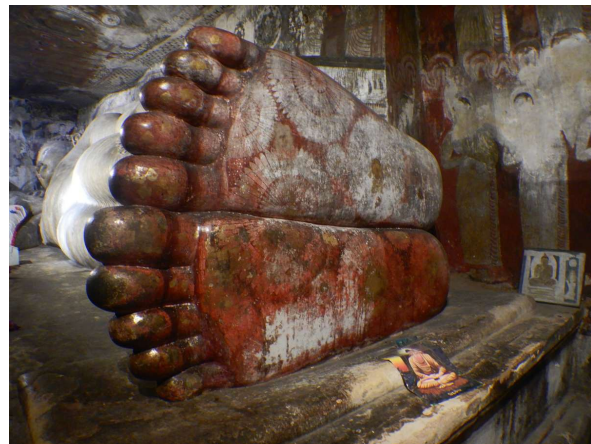
Buddahs (meget) store fødder

Frokost på en cafe, hvor vi fik en dejlig reje i karry-ret. Så om eftermiddagen vandrede vi ad 600 trappetin op til huletemplerne i Dambulla.