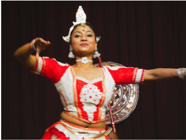
Danseshow i Kandy

gamle Quens hotel og så gik vi til et lokalt teater ved Kandy søen og så vi et kulturelt danseshow.