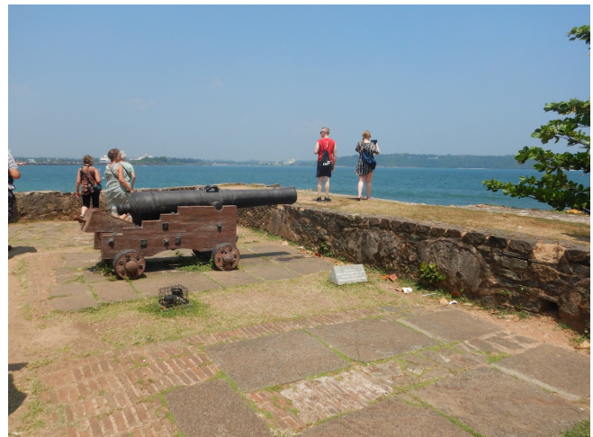
Galle den gamle koloniby, hvorfra portugisernes hollændernes og englændernes kolonisation tog deres udgangspunkt

Denne del af Sri Lanka er mere udviklet end det vi så mod nord og vi kørte forbi fabrikker, industrier og ambitiøse luft-og havneanlæg, inden vi langsomt fik udsigt til havet, palmerne og den tropiske sandstrand. Stoppede i en dejlig pittoresk by, Galle og så det hollandske fort og de smalle gyder med fine design og kunstbutikker.