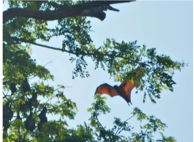
Ikke alt der flyver er fugle. Her er det en flyvende hund (en stor flagermus)

Lige bag pottemagerens værksted oplevede vi et par fantastiske træer med flyvende hunde (store flagermus). Et fantastisk syn.