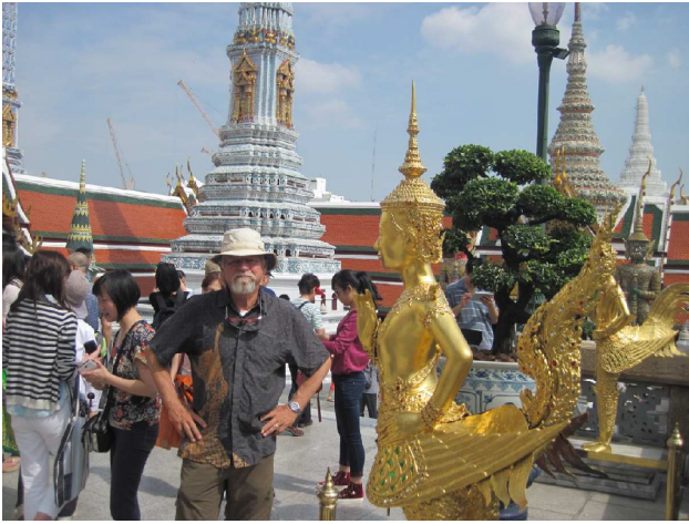
Paladset i Bangkok