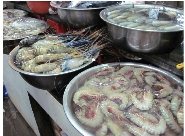
Markedet, her i fiskehjørnet