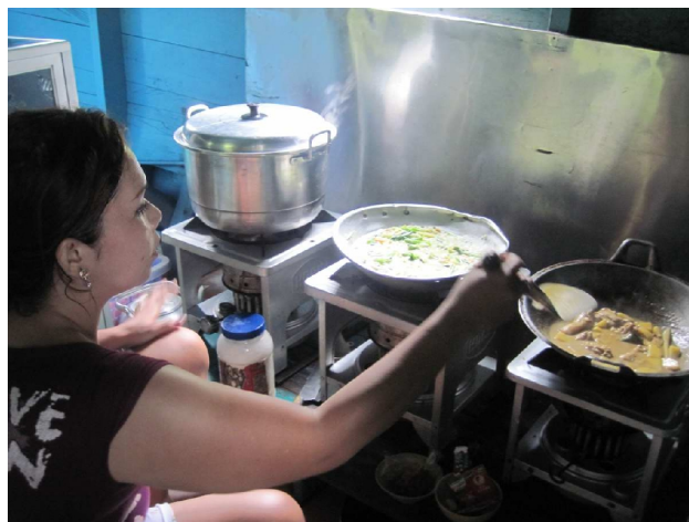
Rosita i pantryet

kop kaffe før vi gik i land. Indonesisk kaffe bliver lavet ved at man fylder koppen kvart op med malet kaffe og hælder kogende vand på. Så røres der kraftigt og man venter til kaffen er faldet til bunds før man drikker. Smager fint! Derefter gik vi op til foderpladsen. Det var fascinerende at se orangutangerne komme ned fra træerne, og bruge arme og ben, holde i lianerne og om deres unger samtidig med at de skraldede bananer med munden.