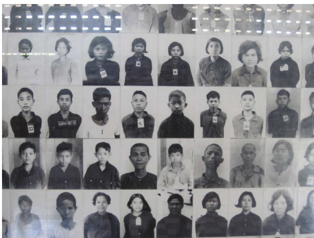
Et udvalg af de tusindvis af fanger der er blevet tortureret i Toul Seng

Derfra tog vi en tuk-tuk til De Røde Khmers berygtede fængsel: Toul Seng S-21. Inden de Røde Khmer indrettede det til fængsel var det en folkeskole. Det var ret forfærdeligt at se de tidligere klasseværelser, hvor de havde tortureret fangerne og dels de bitte små celler de havde indrettet til fangerne. Når tilståelserne så var faldet, blev fangerne så kørt ud til en af de mange 'killing fields'. De Røde Khmers styre varede kun fire år, og i den tid nåede de at slå to millioner ihjel: alle lærerne, de der talte fremmedsprog og de der havde en boglig uddannelse. Resten blev sendt ud på landet for at realisere en drøm om at dyrke landbrug som man gjorde det i Khmerernes storhedstid omkring år 800 til 1200.