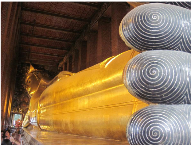
Den liggende Buddha