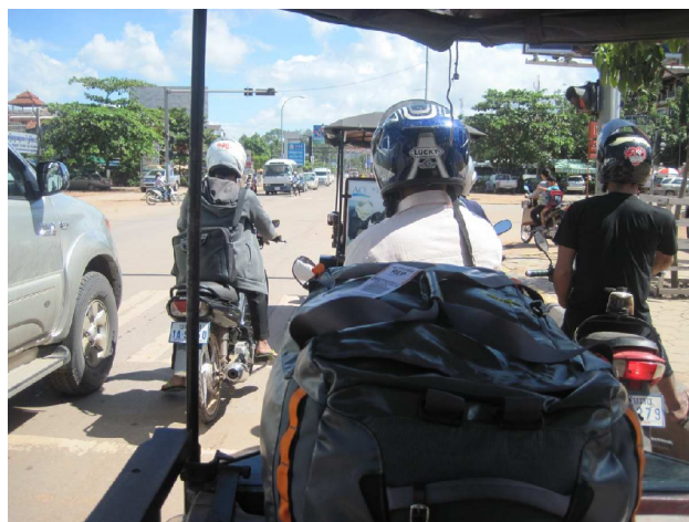
En tuk-tuk fra Mom's guesthouse hentede os i lufthavnen