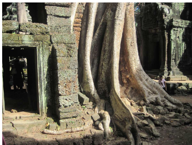
Et af templerne er stadig overgroet af meget gamle træer