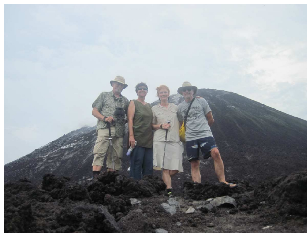
Hvis røgen skifter farve: løb og pas ikke at få sten og lava i hovedet!

Den osede hele tiden og vores guide sagde, at hvis røgen skiftede farve skulle vi vende om og skynde os ned ad vulkanen og sikre os at vi ikke fik sten og lava stykker i hovedet. Utroligt fascinerende sted, denne vulkan hæver sig seks meter om året.