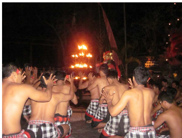
Balinesisk dans, vist kaldet 'abe dans'

Bytur i Udbud. Først gik vi ud i den anden ende af byen, fordi det var der, man nogen gange kunne se dukke-skyggespil. Det var der dog ikke i aften, men der fortalte de, hvor vi kunne gå hen, hvis vil ville se noget i aften. Det var i parallelgaden til hvor vi bor, så vi hentede billetterne inden vi gik tilbage til hotellet for siesta og en tur i pølen.