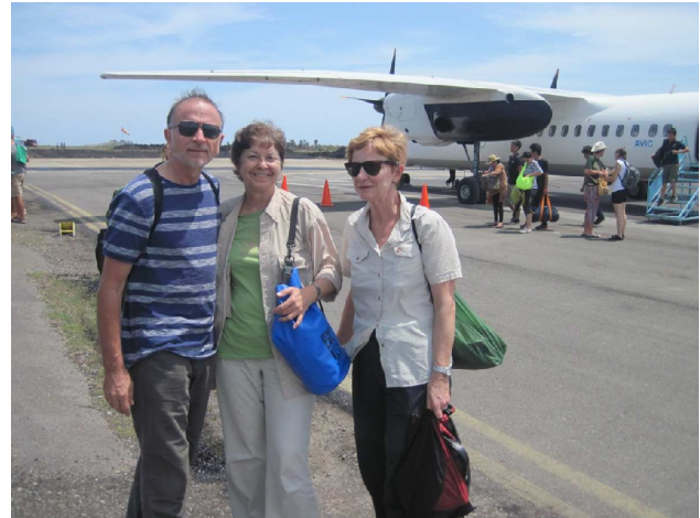
De rejsende undtagen fotografen / billedredaktøren