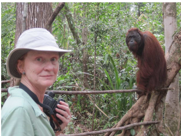
Ved orangutangernes foderplads i nationalparken

Her er flokken ikke så stor og kun tre orangutanger kom til foderbrættet. Vi er i et område, hvor man rehabiliterer tamme og forladte orangutanger, for at vænne dem til at leve i regnskoven igen. Derfor fodres de, og når de ikke kommer til foderbrættet, kan det skyldes to ting. At de har lært sig selv at finde mad eller at der er mad nok i skoven så de ikke er sultne. Begge dele er jo OK. Her var orangutangerne ikke glade for at være ved foderbrættet samtidig; en af dem var der kun så kort tid at den lige kunne nå at stoppe 10-15 bananer i munden før den for op i trætoppene for at spise dem i fred og ro.