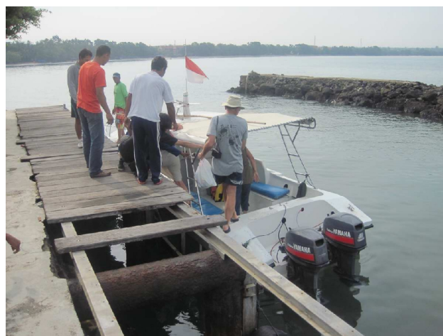
Afgang mod Krakatau

(Krakataus barn), den vulkan der blev tilbage, da alt det andet var sprunget i luften.