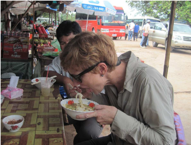
På marked; vi fik fiskesuppe