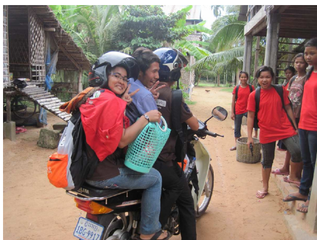
Det var OK vejr da de tre engelsklærere forlod landsbyskolen

Kontorarbejde om formiddagen. Om eftermiddagen var vi inviteret ud i en af de landsbyer, hvor en af NGO'erne underviser ved frivillige i engelsk. På vej ud til den landsby, besøgte vi skolen ved Khnat og konstaterede at arbejdet med håndvaskene og pissoirerne skrider frem. På landsby skolen fik vi lov at undervise i engelsk, og det var sjovt, lidt forskelligt fra at undervise på de andre skoler, mest fordi klasserne var mindre, her kunne man nå alle eleverne.