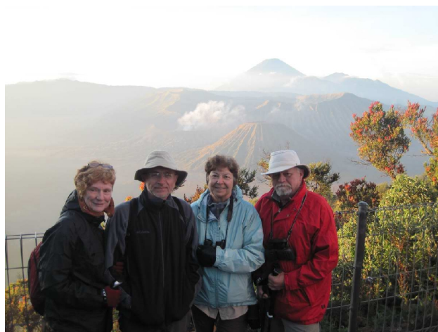
Tidligt op, og oppe på Mt. Bromo