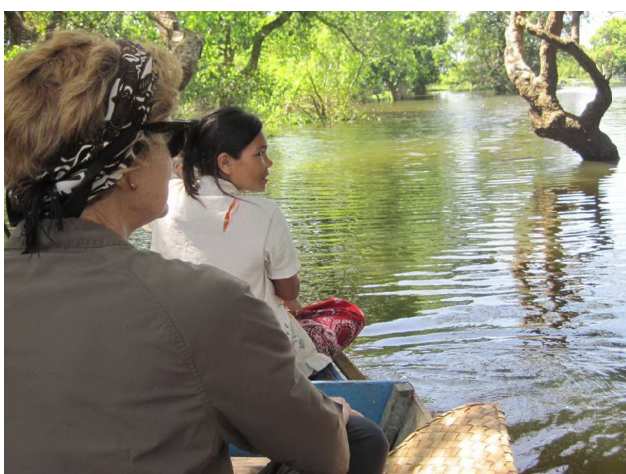
Vi blev sejlet rundt mellem trætoppene

Vi lejede en tuk-tuk og kørte ud til bredden af den sø der for øjeblikket dækker et stort område langs Tonle Sap floden. Det betyder også, at fiskelandsbyerne, der normalt ligger ved søens bred er oversvømmet. Heldigvis er de bygget på ti meter høje pæle, så de stadig kan fiske fra deres huse. Det er utroligt flot og fascinerende. Vi blev sejlet langt ud på søen i en motorbåd til en af byerne og fik så i byens udkant mulighed for at sejle videre i en sampan, en lille bitte fladbundet kano. Så vi sejlede rundt mellem husene, fiskenettene og trækronerne. Dejlig oplevelse.