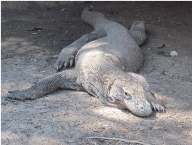
En velvoksen komodovaran

Vil gik den længste af de ture, der blev tilbudt. Den kom til at vare lidt mere end to timer, og det var varmt! Vi var glade for, at vi var kommet herud så tidligt på dagen. Den første voksne varan vi så, lå ret stille under et træ, hvor en masse aber fouragerede. Han ventede nok på et enkelt fejltrin, fra en af dem. Den næste vil så, var en hun, der badede i et vandløb, det foregik i et adstadigt tempo, men vist nok lidt vildt efter varan-målestok. En rigtig stor han var vi lige ved at overse, for han lå helt stille, og han var ikke i særlig god foderstand. Vil holdt os i ærbødig afstand, og lod ham vente, på mere passende bytte. En lille bitte varan på ca. fire måneder sad oppe i et træ, og ventede på termitter, ude af rækkevidde fra de voksne. Ud over varanerne så vil aber og vandbøfler. Ingen fugle for de spiser det samme som aberne, så der er ikke plads til dem her. Der skulle ikke være aber på Komodo, så der er fuglelivet rigere. Vi sejlede derfra og ud til en bugt hvor der ved højvande kommer manterays (rokker) for at fouragerer. Vil så et par stykker fra båden, det lykkedes os at komme i vandet sammen med en. Ret fascinerende.