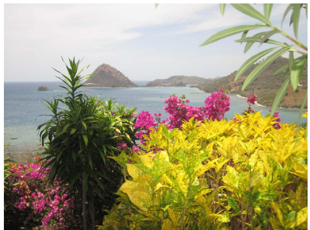
Tilbage til det dejlige hotel med den fine udsigt i Labuan Bajo

Vi var godt stegte da vil kom tilbage til båden så vi var glade over at komme på havet igen. Der var ikke meget vind så ikke luftede ret meget. Vi fik endnu en gang dejlig indonesisk mad og fik mulighed for at snorkle to gange inden vil sejlede tilbage til Labuan Bajo, og blev kørt til det samme hotel, som vil boede på da vil ankom. Vil fik os en øl, og så et brusebad, det trængte jeg i hvert fald til.