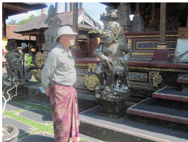
Fotografen på tempelbesøg, passende påklædt

Klokken er halv ti, vi sidder på terrassen foran vores bungalow. Vi har pakket og er klar til at taxaen henter os om en times tid. Så flyver vi til Yogyakarta, hvor vi skal se tempel, sølvsmedeværksted og batikværksted i morgen. Så lige nu er der dømt afslapning.