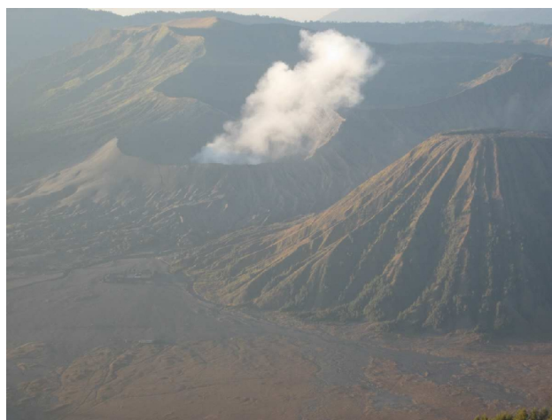
Vi kom op på kanten, og så hvorfra det dampede og osede

Vi kom op på kanten, og så ned i selve krateret, hvorfra det dampede og osede op. Ret fantastisk.