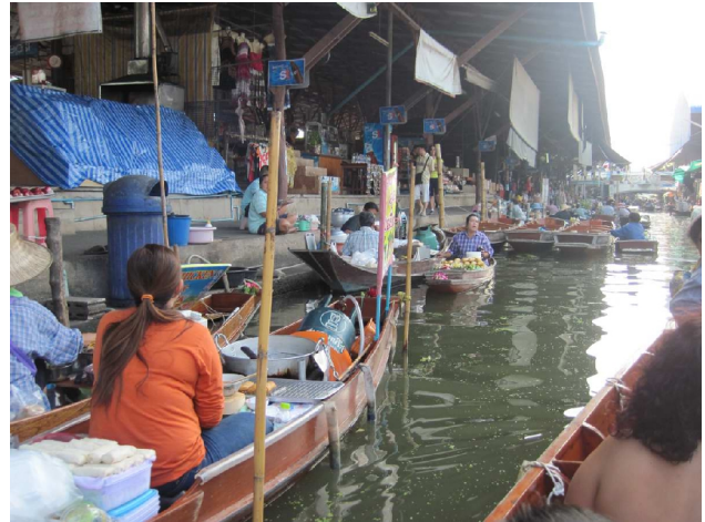
Det flydende marked

Tog tuk-tuk til Siam Square. Det er alskens indkøbsmuligheder. Dels et lokalt marked med masser af tøj og lignende, dels tre kæmpe stormagasiner med alt i alle prisklasser, og forretninger jeg aldrig har været i og sikkert aldrig vil komme i. Det var sjovt at se og en stille måde at nærme sig civilisationen på.