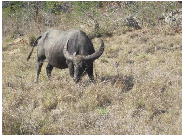
Varanerne dræber og spiser voksne vandbøfler

Vil havde ankret lige uden for rangerstationen, så vi var hurtigt i land på Komodo. Vil så varaner allerede på ranger stationen, da de samles der, da de tror de får mad der. Ifølge rangeren der fulgte os rundt, bliver de ikke fodret. Vi gik en tur på ca. to timer, ikke mere end 4 km, men det er rigeligt i den varme. Vil så varaner undervejs, de er altså specielle at se på.