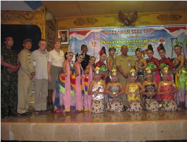
Honoratiores (det var blandt andet os) blev fotograferet sammen med de optrædende