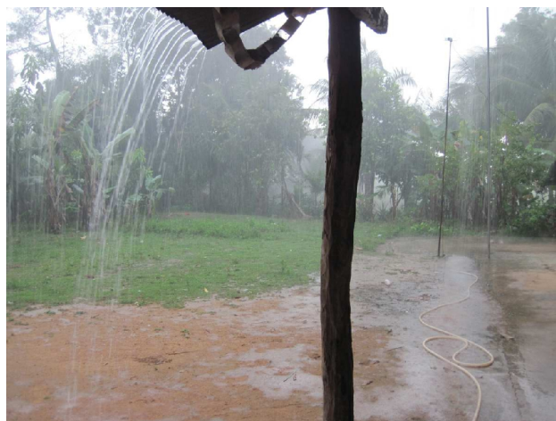
Vi fandt ly på vejen hjem

Fruen i huset, stod og ordnede fisk til aftensmaden, tog pænt imod os og vi ventede næsten tre kvarter indtil de stilnede af, og så drog vi videre. Man får altså snavsede bukser af at køre på mudderveje, på motorcykel i regnvejr. Selv om vi var drivvåde ville vi lige ned forbi markedet på vejen hjem for at hente vores nattøj. Hende vi havde lavet aftalen med var der ikke og hendes assistent sagde bare at det ikke var færdigt! Her stod vi så uden nattøj, vores silke, hrmpf nu var det ikke sjovt længere.