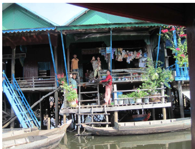
Husene i fiskerlejet på Tonlesap's bred er bygget på 10 meter høje pæle. I sommerperioden er vandet steget seks meter