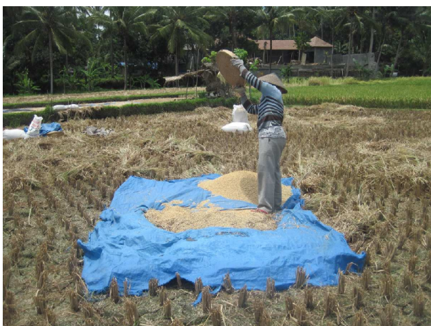
Riskerne skilles fra stråene

Lang gåtur først langs floden nordpå langs Campuang ridge. På vej tilbage mødte vi en guide, der ville tage os en tur ind over rismarkerne. Det var en oplevelse. Vi så kvinderne høste og tærsk. Vi så ænderne snadre i de høstede marker.