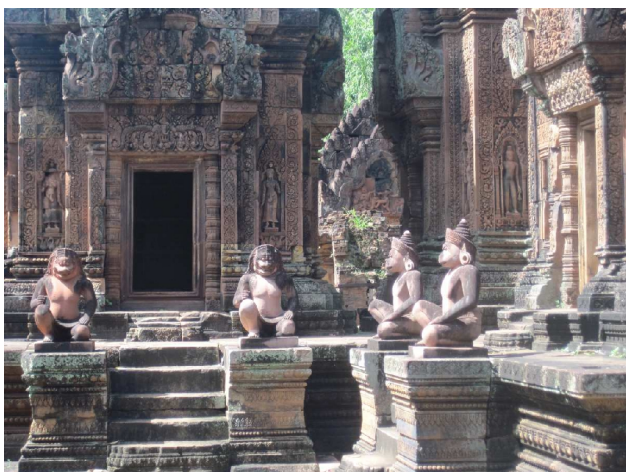
Et andet tempel ved Angkor Wat