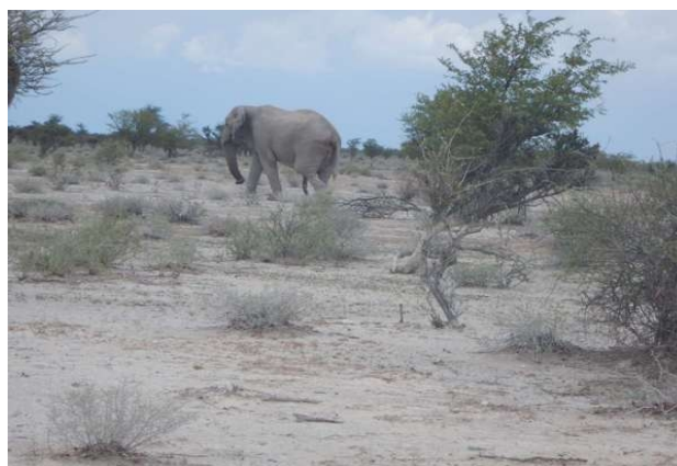
En enlig hanelefant

Tilbage på Opuvo Country Lodge (som vi havde overnattet på to dage før), blev vi indkvarteret igen og vi tog os en dukkert i poolen, og forkælede os selv med en konjak til kaffen efter maden.