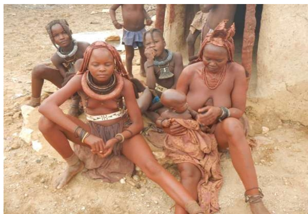
Himbakvinder og -børn

Afgang nordpå mod Epupa Falls klokken halv ni. Vi var fremme ved teltene (der var af luksus-udgaven med privat terrasse), hvor vi skulle sove, ved et-tiden. En blandet salat til frokost, og så satte vi os ved flodbredden for at nyde freden og det smukke landskab. Det var meningen at vi skulle have haft vores sun-downer ved vandfaldet, men en byge med masser af vind og vand forhindrede det. Middag med namibisk vin til maden (ja, de laver vin i Namibia og den var bestemt drikkelig) ved den brusende flod, og så på puden i teltet. Et dejligt fredeligt sted, hvor vi virkelig fik mulighed for at slappe af.