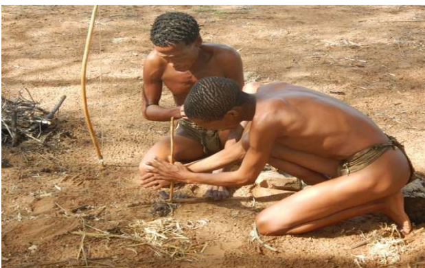
En dag i en buskmand liv

Så endnu en dag "on the road again", hvor vi kørte østpå over Otavi Mountain Range. I dag heldigvis ad gode veje, så vores nyrer blev hvor de skulle. Målet var Roy Camp via Outjo, Otavi, Grootfontein. Vi så noget minedrift efter kobber med betydelige bi-forekomster af bly og sølv (Kombat mining) undervejs, og fik tilbagelagt mere end 450 km i dag. På vejen så vi verdens største jernmeteorit (Hoba meteoritten, >60 tons), der er faldet ned her for rigtig mange år siden (ingen ved hvornår) og det kæmpekrater, der angiveligt må have været, er helt forsvundet. Den vi har på mineralogisk museum er ikke nær så stor, selv om den er den 6.-største i verden med sine cirka 20 ton. Roy Camp hvor vi skal overnatte de næste to nætter er et spøjst sted, helt anderledes end de tidligere mere 'strømlinede' lodges. Hytternes kvalitet er helt i top men udsmykningen består af gamle landbrugsredskaber og andet skrammel. Lidt af en losseplads (men bestemt på den gode måde).