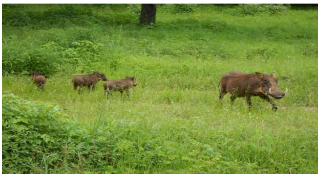
Vildsvin og vild-svine-grisse-basser