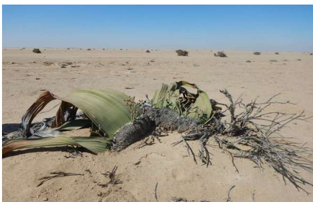
Welwitschia mirabilis; planten der er stamfader til alverdens kogleplanter

Om formiddagen kørte vi mod syd og lidt mod øst ind i ørkenen, her så vi et besynderligt fænomen: meget store sten med slæbespor efter sig! Lars forklarede det ved, at når sandet bliver meget varmt, så skabes der et glidende lag således at stened begynder at vandre (skubbet af vinden) hen over sandet, og det kan angiveligt gå ret hurtigt. Vi så også nogle nitrit aflejringer, der er tegn på, at her er et kedeligt miljø for planterne her i området.