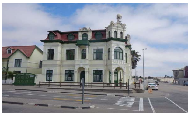
Mere tysk indflydelse i Swakoopmund