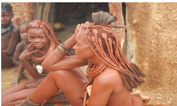
Himbakvinde med brudekrone

store, det må være en daglig vægttræning. De kønsmodne piger er ofte lovet væk, men er ikke forpligtet til at gifte sig med den udpegede, hun har (angiveligt) lov til at sige nej, lige så mange gange som hun vil. Det siges, at de ikke får så mange børn, men det siges ikke hvordan de undgår at få mange børn. De ikke kønsmodne børn har deres hår flettet frem over panden, drengene i en enkelt fletning, pigerne i to. Vi fik mulighed for at hilse på mange af byens kvinder og børn. De var meget imødekommende og smilende, men talte kun deres eget sprog, så det var ved hjælp af en guide, at vi fik oplysningerne ud af dem. Forkvinden kom, da vi havde været der et stykke tid. Hende skulle vi også hilse formelt på, men det gik hurtigt op i fnis og latter.