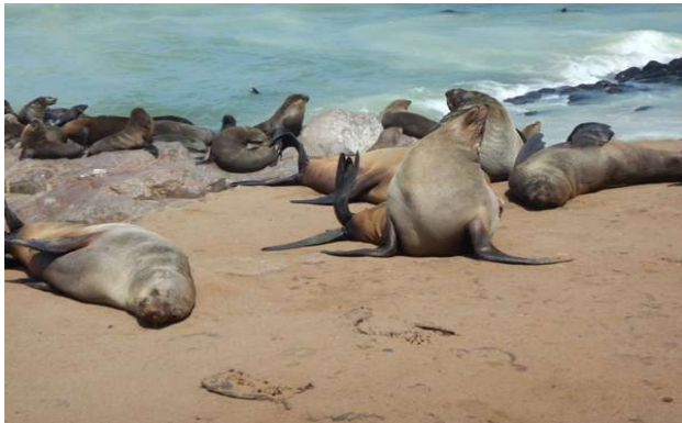
Den store koloni af pelssæler

ligner på alle måder en søløve med en hals der gør at den kan dreje hovedet og med luffer (og hale) der gør det muligt for den at bevæge sig (ja nærmest løbe) ganske hurtigt. Der var mange og i alle aldre, især mange unger på blot få uger, fascinerende og meget ildelugtende.