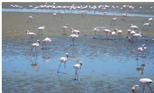
Tusindvis af flamingoer i Walvis Bay

Op klokken syv og afgang til morgenmad i byen, da der ikke var servering hvor vi bor. Jeg fik noget der på spisekortet hed Birds Food, det var yoghurt med frø, mysli og frugt, lige noget for mig. Vi var 'on the road again' allerede klokken ni, for vi havde en lang tur på vejene foran os. Nordpå langs den ugæstfri kyststrækning med det malende navn Skeletkysten (Skeleton Coast) mod Cape Cross. På vejen et stop for at se på et skib, der var forlist lige uden for kysten og som nu stod som et ... skelet.