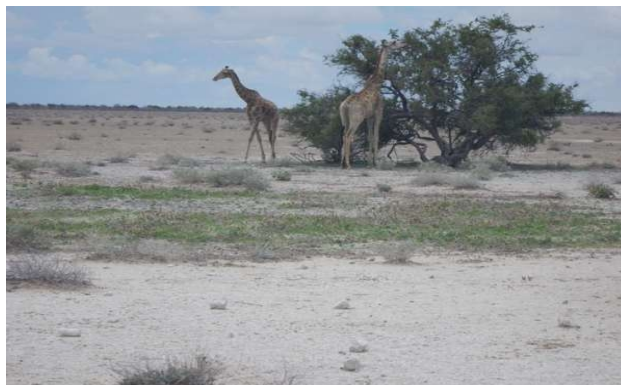
Giraffer på savannen

pede ved, da de nu kan finde vand andre steder. Men vi fandt da nogle vandhuller, hvor nogle løver nød livet. Ud over det, så vi springbuk, gnu, sjakal, hartebeest (ko-antilope), giraf, zebra, onyx, leopardskilpade, struds og en enkelt lille varan. Efter vi havde gjort stop i Okaukuejo, der ligger centralt i Etosha National Park (en tidligere militærbase) fik vi regn mens vi kørte sydpå gennem Andersson Gate. Derefter ud til Teleni Etoshi Village Camp der ligger lige udenfor parken. Her skal vi overnatte i to nætter, så jeg udnyttede lejligheden til at få vasket lidt tøj. Aftensmaden var en buffet, hvor vi kunne vælge mellem alskens kød, og nogle sydafrikanske vine....og det fortsatte med at regne.