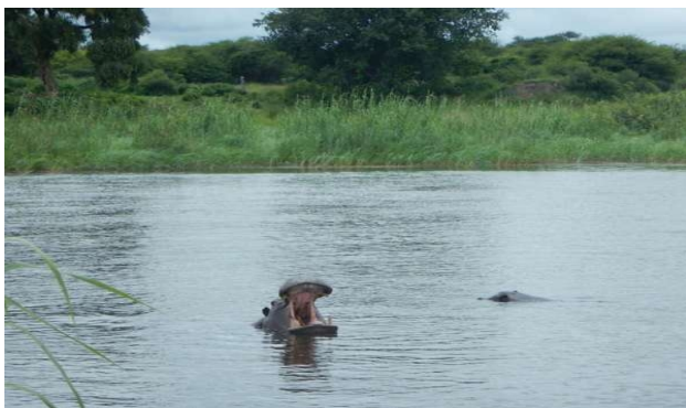
Flodheste i floden

Der kunne hjulene tjekkes og blive pumpet op, mens vi fik en kop kaffe på et fint sted, lidt koloniale med fine græsplæner og påfugle. Vi var fremme på Shametu Lodge ved tre tiden; fantastisk sted lige ved floden, vores telt-balkon rager ud over floden. Her var der også lidt koloni-safari-agtig stil over det. Solnedgangs-sejltur, over til Popo vandfaldet, hvor der blev serveret øl og snacks, fin tur. Så tilbage til lodgen, hvor vi fik en dejlig veltillavet middag.