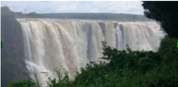
Victoria Falls er meget stort!

Dagen startede med en overdådige morgenbuffet. Derefter gik vi en tur langs Victoria Falls. Der falder meget vand, meget langt ned og vandet sprøjter op nedefra og en stor del af turen er i en "cloud forrest", så visse steder ligger i konstant 'regnvejr' så det var en våd, men en imponerende og flot tur. Så nu kan vi så sammenligne Iguazu i Argentina og som oplevelse står Vic Falls ikke tilbage, om end det som turistattraktion synes væsentlig mere præget af turisme.