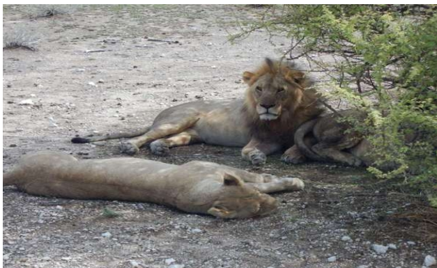
Løverne ligger i buskens skygge i middagsheden