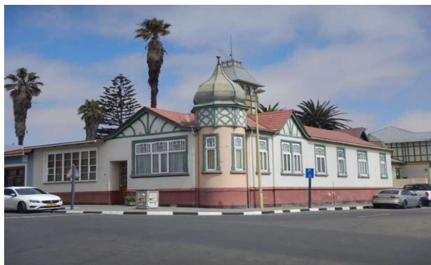
Tysk indflydelse i Swakopmund