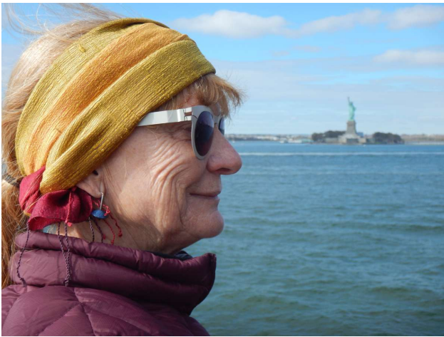
Færgen til Staten Island