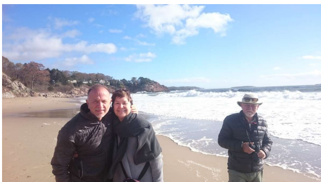
Ved havet ved Rockport

Kørte en tur nordpå fra Salem via Manchester by the sea, Gloucester og helt ud til Rockport. Derefter via Essex tilbage tilbage til Salem. Vi stoppede mange gange og så de karakteristiske træhuse, de dejlige strande der nu er præget af efterårsvejret, men også med imponerende bølger i dette solskinsvejr. Det var en tur langs en klippekyst der er præget af tidevand og små fiskerbyer med masser af hummerbåde og hummertegn. Alle byer meget imødekommende og området er utroligt velholdt. Vi er tydeligvis ikke i den fattigste del af USA.