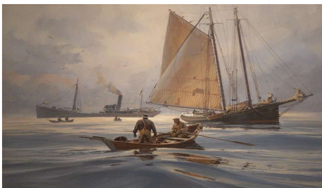
Peabody Essex Museum havde en fin samling maritime billeder

der beskriver livet i huset som blev beboet af alle generationer i en familie, der drev handel.