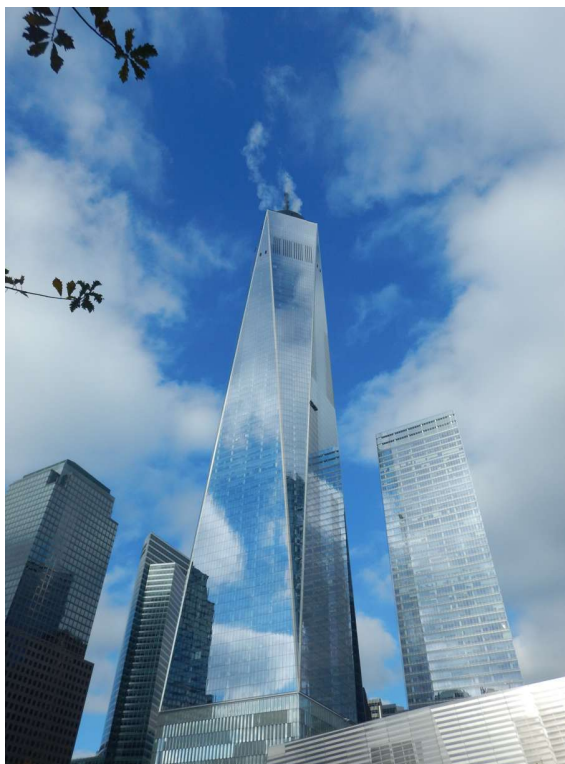
New York skyline

Ssted tæt på hotellet, hvor de serverede rib-racks. Vi delte sådan en til middag (og der var rigeligt) og tog tilbage til hotellet.