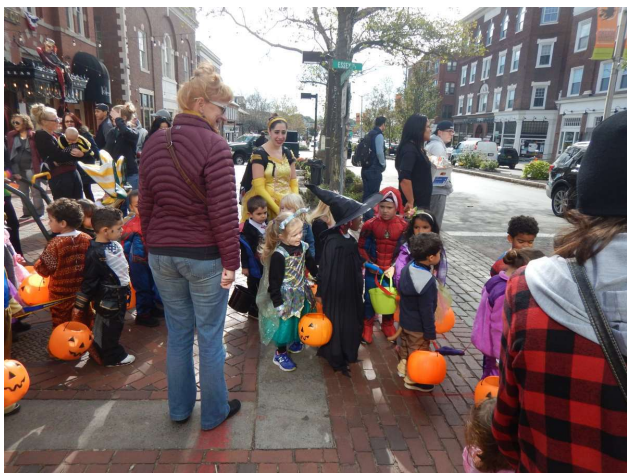
Pædagoger burde forgyldes!

Vi blev parkeret udenfor hoveddøren i to campingstole med en stor skål med slik i (alt var pakket-ind-ind-slik) med aftalte stykker, så man ved hvad der blev delt ud - Virginia havde 270 stykker slik og ovenboen havde over 400 stykker...Der blev givet strenge instrukser om, hvorledes det skulle deles ud ved give dem et stykke hver i hånden. De måtte ikke få mulighed for at grave deres små barnehænder ned i skålen og rage til sig. Der var et par gange, hvor jeg var uopmærksom og der var pludseligt mange hænder nede i skålen og jeg måtte kaste min overkrop over skålen.