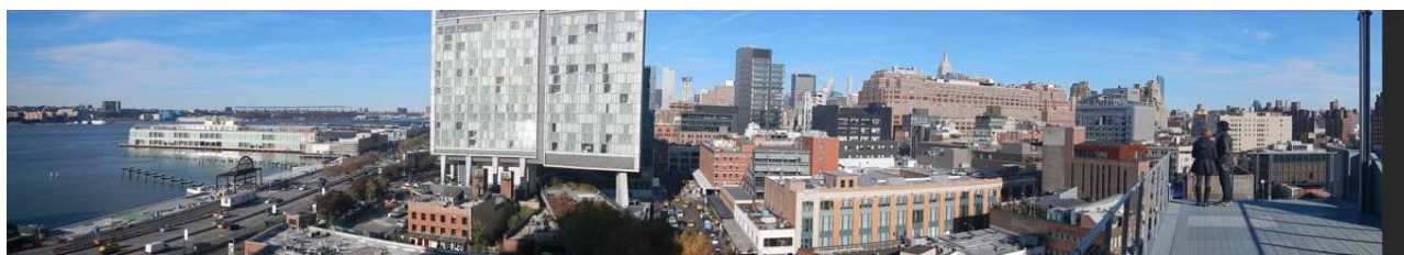
New York, Westsides skyline fra Withney Museum of Modern Art