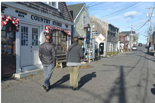
New England, fiskerby

Ellers var det en stille dag, og jeg synes vi er kommet os forbløffende hurtigt over vores jetlag, men sådan er det jo ofte på udturen, hvor adrenalinen kører. Det bliver nok værre når vi kommer tilbage til Palermo.