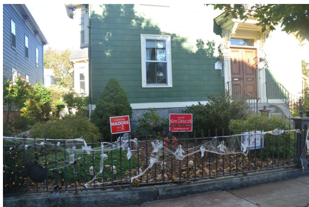
41 Forrester Street Salem, MA 01970