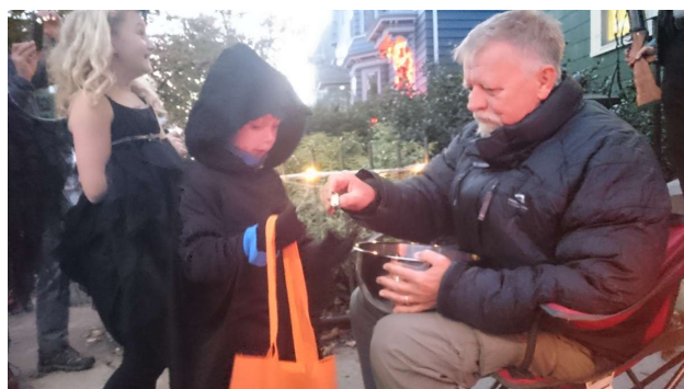
Trick or Treat.

Klokken fem gik vi op til The Commons (byparken /fælleden) for at se heksene danse. Der er en gruppe moderne hekse, der har en masse medlemmer her i Salem, og som under diverse besværgelser og ritualer påkalder deres guder og danser her på fælleden på Halloween aftenen i solnedgangen. De var også klædt festligt ud, men det var noget man tog ret alvorligt og det var sjovt at se. Derefter gik vi hjem og gjorde klar til at tage imod alle børnene, som kom med deres poser til Trick or Treat. mellem klokken halv seks og til ved otte tiden.