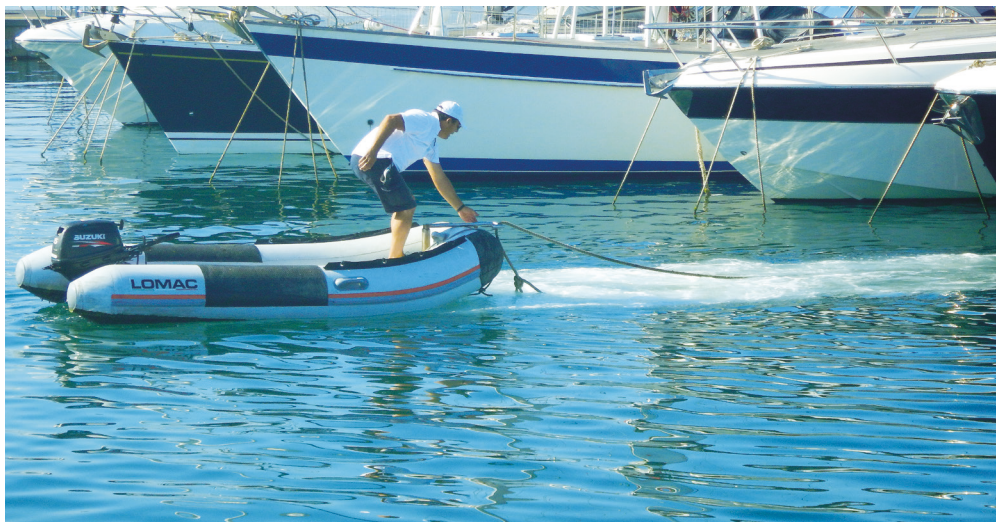
I de mange større middelhavs-marinaer overlades intet til kunden selv. Her hjælper en marinero med den faste for/agter-fortøjning.