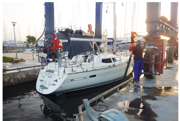
Troldand tages på land i Preveza. Fra vi – via VHF'en – blev kaldt til "slæbestedet", og til vi stod opklodset i stativet gik der mindre end 1½ time.

Seneste "vinterhavn" hidtil har været ved Preveza, også i det Ioniske. Byen har p.t. ingen egentlig marina, men man kan komme på land hos en af tre enorme bådopbevaringsindustrier med adgang til sejmager, rigger, mekaniker etc., der ligger på den anden side af sundet. Der er tre forskellige muligheder, vi lå i Cleopatra. Her bestilles plads på forhånd og betales et depositum, hvorefter man aftaler dag og et tidspunkt for optagningen. Derefter er det så blot at holde sig klar uden for slæbestedet med VHF'en tændt, og mindre end to timer efter står man på land, trykspulet og i stativ. Alt fungerer super effektivt (og meget lidt græsk); men stedet er ren opbevaring og ikke et sted man bliver længere end højest nødvendigt. Lokaliseringen lige op af Aktion lufthavnen gør denne løsning uhyre populær blandt sejlere, der kommer ned i kortere perioder. Så kan man få klargjort og søsat båden til aftalt tid, sejle i en afgrænset periode og så igen efterlade båden for optag og vedligehold.