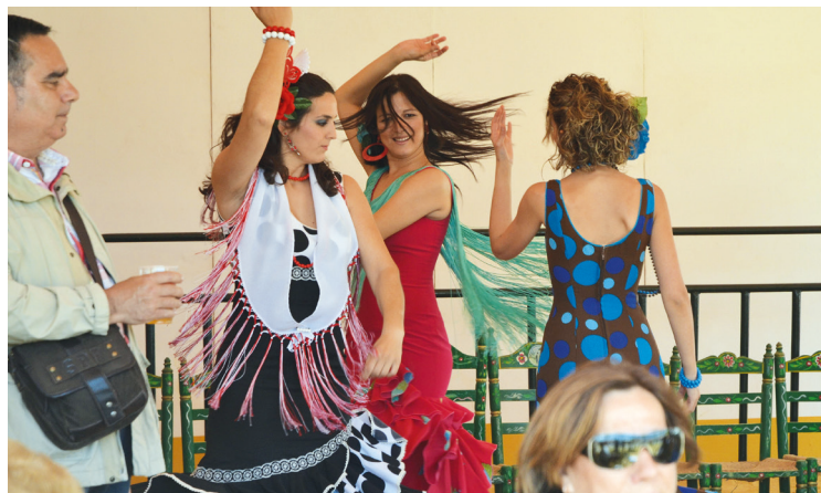
Sevillas årlige aprilfestival er en folkefest, der kører non-stop 20 timer i døgnet i en hel uge. Her danses der Sevillana.