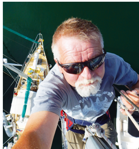
Forfatter-selfie taget under den årlige inspektion af riggen.