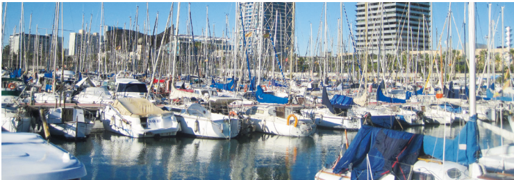
Port Olympic i Barcelona ligger særdeles centralt (på godt og ondt).