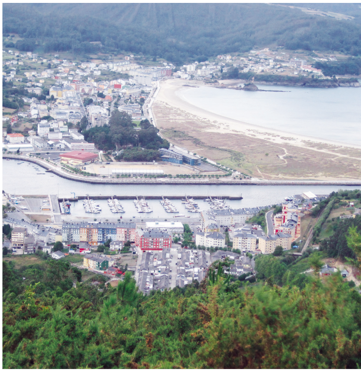
Den lille velbeskyttede marina i Vivero (Galicien), der ved et tilfælde blev vores første vinterhavn.