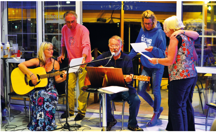
Torsdagsaften med musikalsk underholdning. Ikke altid lige kønt at høre på, men med en fin funktion for fællesskabet.