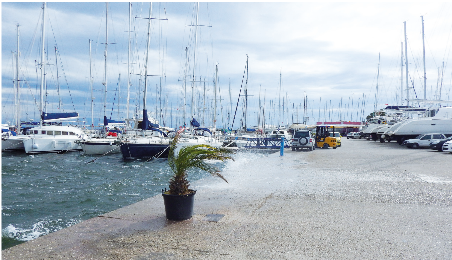
Hvis båden skal blive i vandet (og især hvis den skal efterlades uden opsyn), er det vigtigt, at marinaen er velbeskyttet. Vinterstormene kan være ret voldsomme.

Og til slut: Vil man tilbage til Danmark undervejs er overvejelser om stedets placeringen i forhold til en international lufthavn selvfølgelig vigtig.