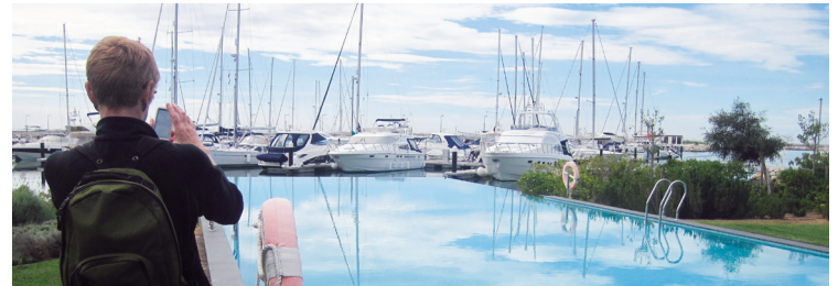
Marinaen i Sant Carles var veludstyret med egen bar og restaurant samt en lille swimmingpool.