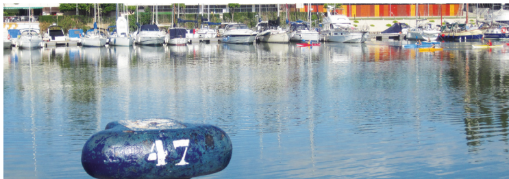
Club Nautico Sevilla har kun en enkelt flydebro med få gæstempladser, og man ligger bare 15 minutters gang fra centrum af en fantastisk by.