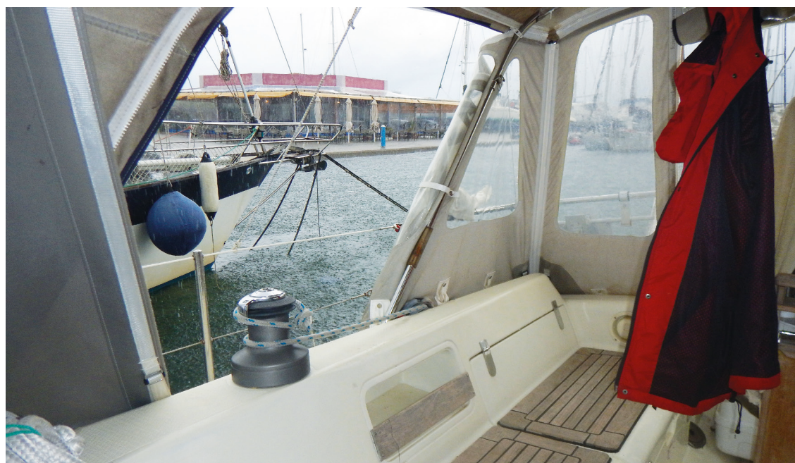
Det kan være både regnfuldt og koldt i vintermånederne, og her slår en bimini (et solsejl) ikke til.

Det er ikke sommer hele året blot fordi man er kommet syd for Biscayen. Faktisk kan det være både regnfuldt, koldt og blæsende at have sin båd stationeret i "de varme lande"; men vintersæsonen byder på en række problemer men også muligheder, som vi ikke er vant til i de hjemlige farvande og som bør overvejes på forhånd.