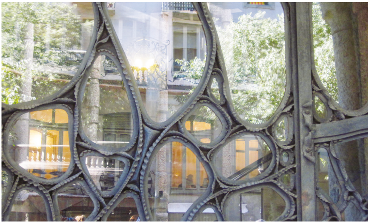
Barcelona spejler sig i vinduerne på en af Gaudis berømte bygninger: "Casa Mila".