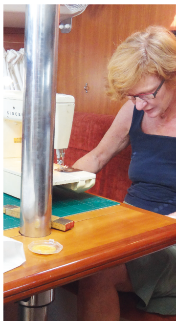
Rie i gang med diverse småreparationer. En symaskine det må man da have om bord.