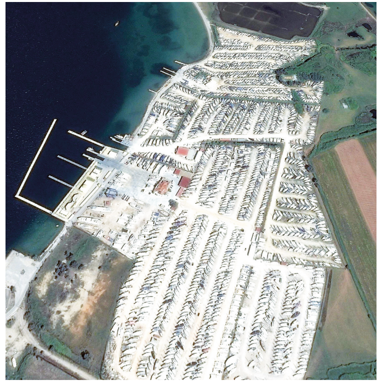
Den enorme og effektive bådopbevarings-operation i Preveza set i fugleperspektiv.

Gode forbindelser til international lufthavn og velegnet for længere sommerture i det Ioniske, til Adriaterhavet eller for sejlads rundt om Peleponnes.