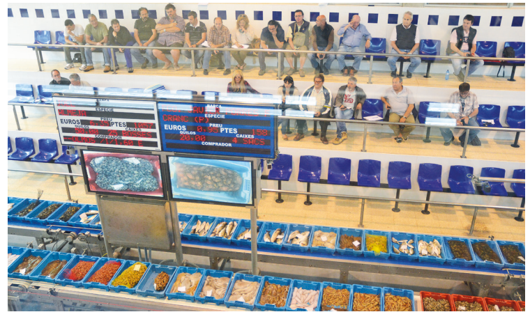
Den daglige fuldautomatiserede fiskeauktion i Sant Carles de la Rapita. En spændende oplevelse.

Landpladsen i Port Olympic er ganske lille, og den udnyttes behårdt ved at have et højt prisniveau, så ingen føler sig fristet til at blive på land længere end et på forhånd planlagt korttids ophold. Det kan give en del stress, hvis vejret ikke er det bedste i den periode, man har reserveret tid på land.